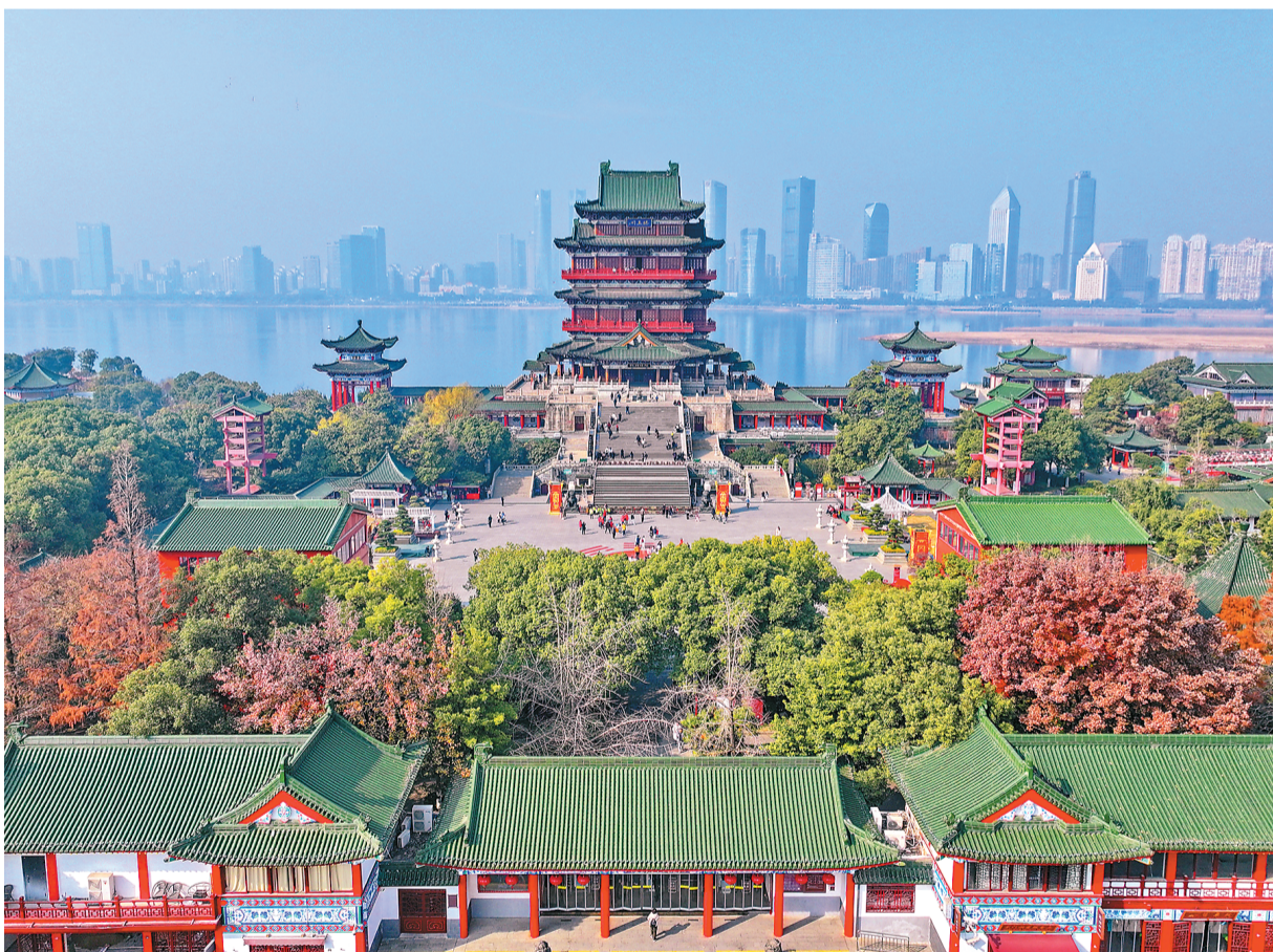
江西省南昌市滕王阁景区“还江于民 还岸于民 还景于民”及北扩工程日前竣工开放，实现了一江两岸古今地标建筑相互交融呼应，构成一道绵延近3公里的旅游风景线。图为1月5日，许多游客前来滕王阁景区游玩，观赏一江两岸古今辉映的独特美景。

2025冰雪季我国冰雪休闲旅游人数有望达到5.2亿人次，旅游收入有望超过6300亿元。 据了解，2024年，我国冰雪旅游领域行业整体投资总额达到1076.91亿元。2018—2024年，我国冰雪旅游领域重资产项目投资累计突破13157亿元。 黑龙江省哈尔滨市、辽宁省沈阳市、吉林省长春市、内蒙古自治区呼伦贝尔市、河北省张家口市、北京市延庆区、黑龙江省牡丹江市、黑龙江省伊春市、吉林省吉林市、新疆维吾尔自治区阿勒泰地区获2025年冰雪旅游十佳城市。