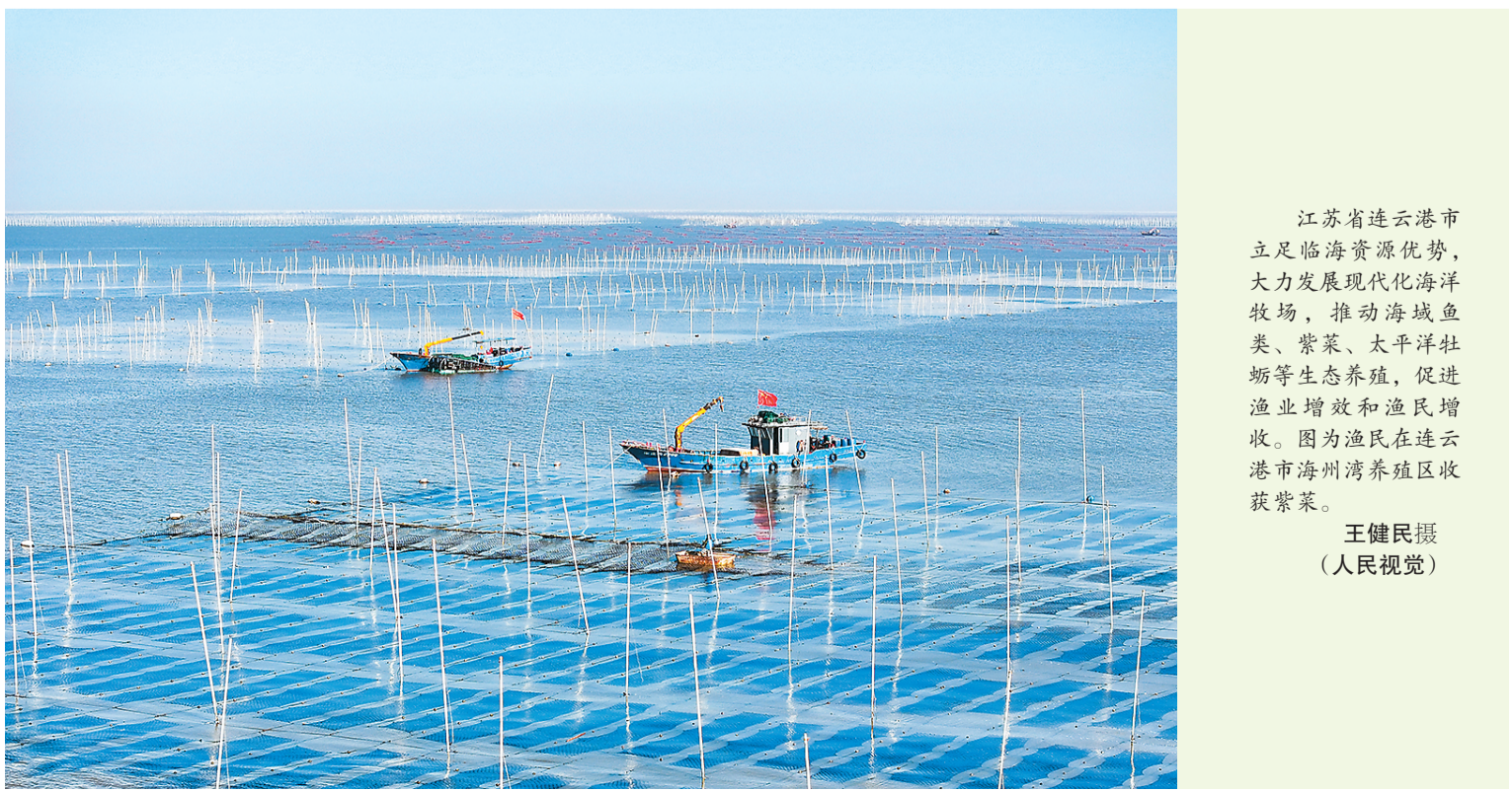
江苏省连云港市立足临海资源优势,大力发展现代化海洋牧场,推动海域鱼类、紫菜、太平洋牡蛎等生态养殖,促进渔业增效和渔民增收。图为渔民在连云港市海州湾养殖区收获紫菜。

市场监管总局有关负责人介绍,将组织各级市场监管部门加强对集贸市场计量工作的监督管理,督促各相关方切实履行主体责任。《办法》的出台将有助于确保集贸市场内计量准确、交易公平,坚决减少和杜绝“缺斤短两”现象,切实维护广大人民群众切身利益。