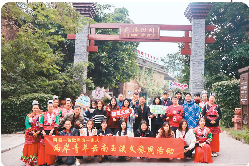
两岸青年云南玉溪文旅周活动