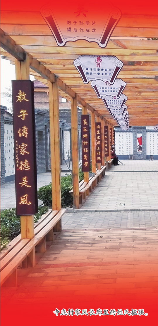
寺底村家风长廊里的姓氏楹联。

“这将是我们的全球华人最值得庆贺的一个春节。”80多岁的温顺逢人便宣传，激动地说：“越是民族的，就越