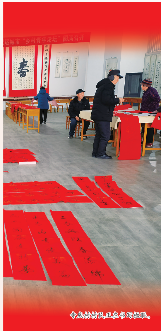
寺底村村民正在书写楹联。