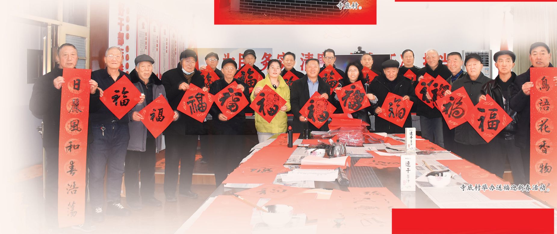
寺底村举办送福迎新活动。

建+楹联”的发展方式。把村里的党员划分为楹联阵地、文化宣传、环境卫生等6个服务小组，建立网格化体系，实行积分制管理，充分发挥楹联文化夯基垒台的作用。