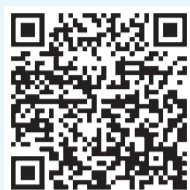
扫描二维码 阅读“融观中国”主页