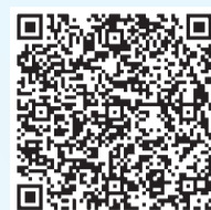
扫描二维码 观看“侠客岛”视频