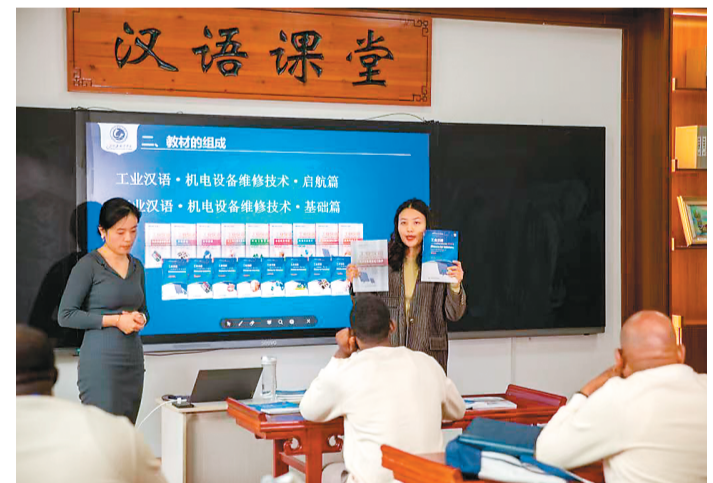
山东理工职业学院为刚果（金）中资企业班开展工业汉语培训。