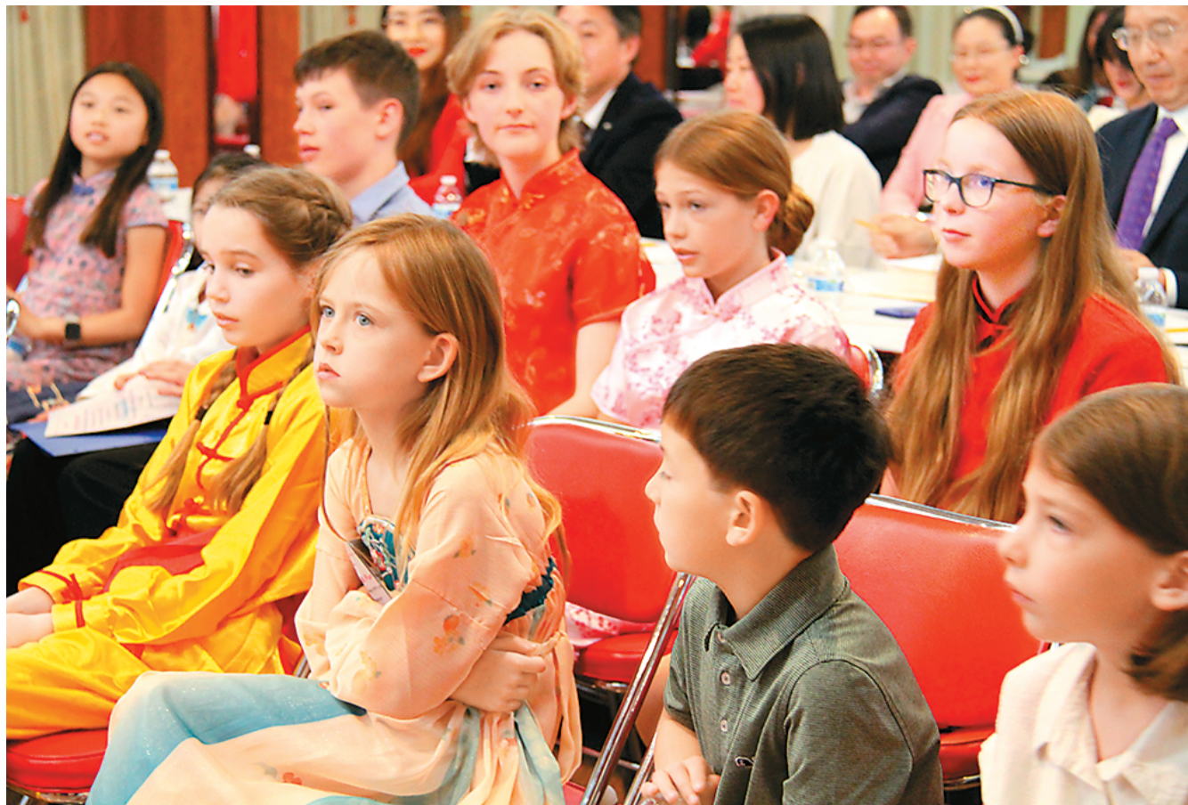
2024年6月，20名来自美国中西部地区8所中、小学的学生齐聚中国驻芝加哥总领馆，秀中文、展才艺，参加第4届美国中西部“汉语桥”初中小学中文秀决赛。图为参加活动的学生。