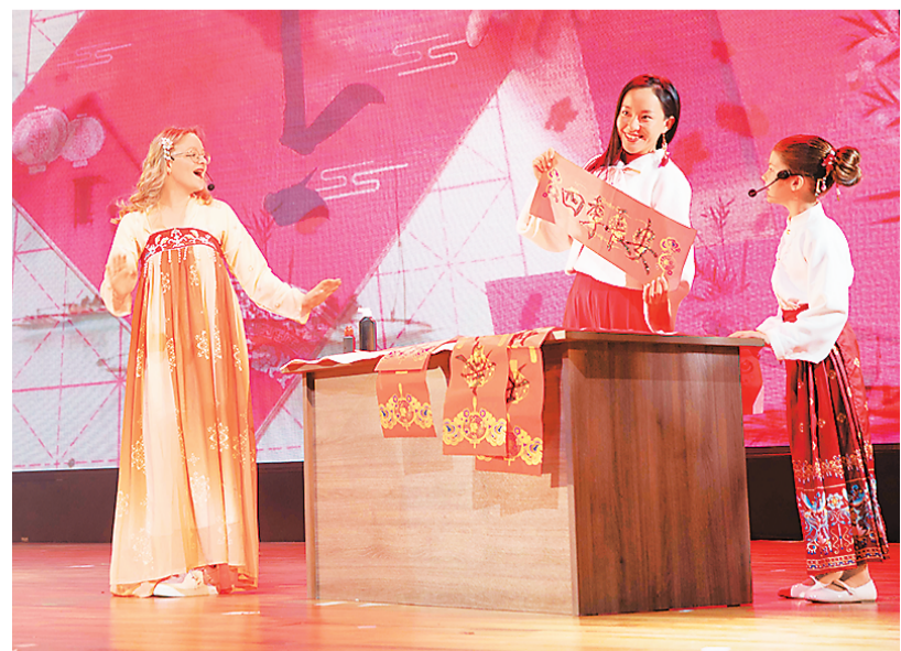
2024年4月，在俄罗斯首都莫斯科，学生们在中文日活动上表演节目。