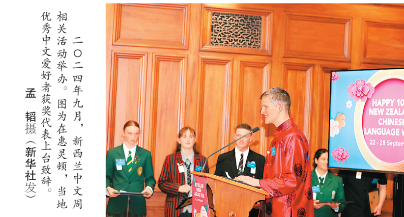
二〇二四年九月，在惠新西兰中文周相关活动举办。图为在惠新西兰中文周优秀中文爱好者获奖代表上台致辞。