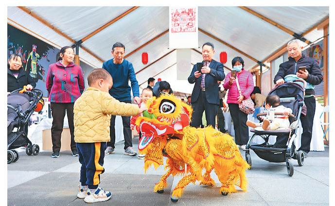
绵阳市“文化三推”深圳行中，“机器狮”受欢迎。

由近及远、从市内到省外，绵阳“朋友圈”越来越广。一年来，绵阳以城为盟、以文为媒、以旅为脉，深化“文化三推”活动，在一次次“走出去”中“引客来”，让世界看到绵阳得天独厚的自然资源、绚丽多彩的文化瑰宝，也在更深层次整合资源，更大范围寻求合作共赢，激发高质量发展新活力。