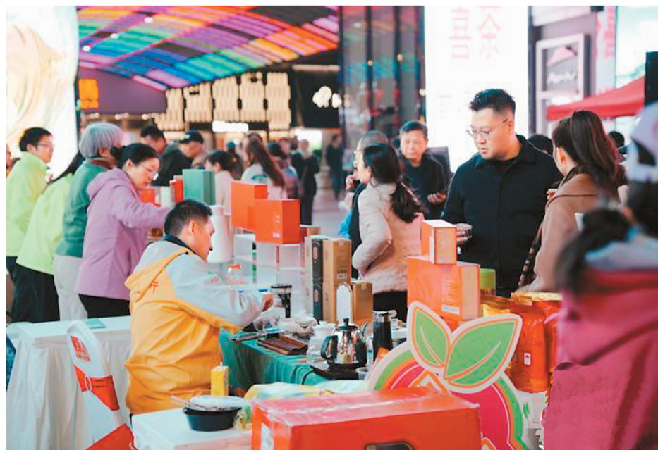
图为琳琅满目的年货产品吸引市民前来选购。

活动现场还见证了一批大湾区企业与清远农业企业的携手结对，实现精准产销对接，进一步推动清远农产品融入全国统一大市场。