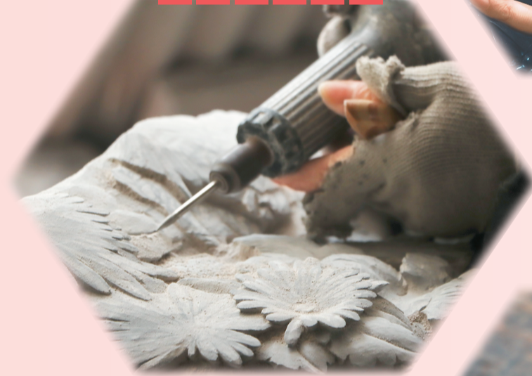
◀ 通过多种雕刻工艺剖出花瓣，使花形显露出来。