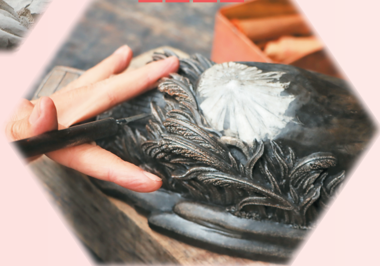
▶ 先点状轻刻，再连点成线、成面，使作品呈现出较强的立体感，这一过程极为耗时。