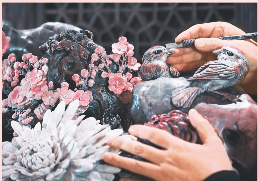
▲ 陈继武在完善一件菊花石雕作品。