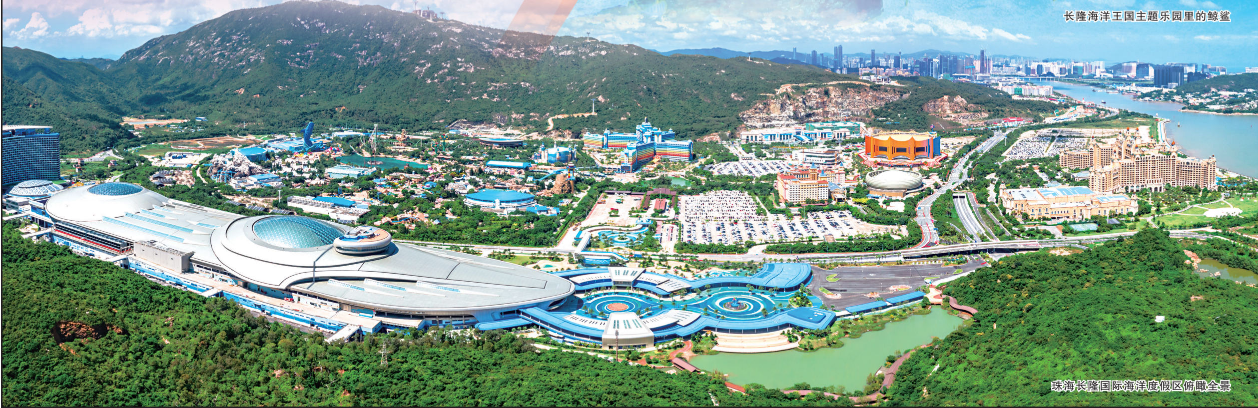
珠海长隆国际海洋度假区俯瞰全景