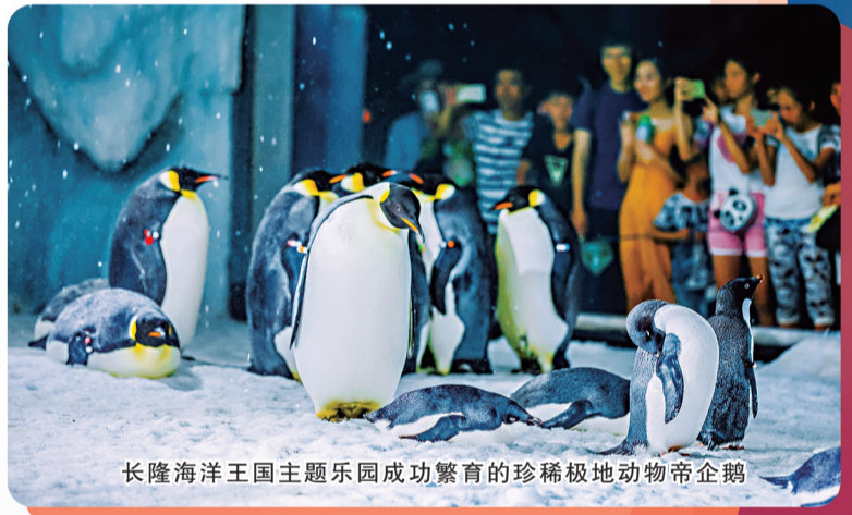
长隆海洋王国主题乐园成功繁育的珍稀极地动物帝企鹅