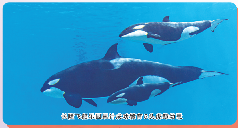
长隆飞船乐园累计成功繁育5头虎鲸幼崽