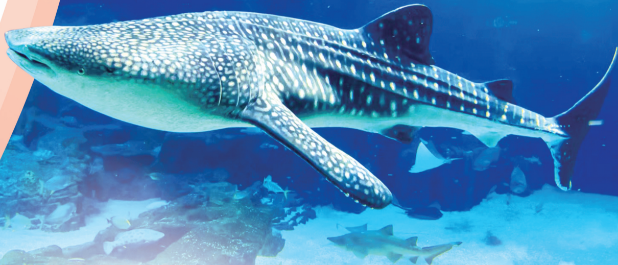
长隆海洋王国主题乐园里的鲸鲨