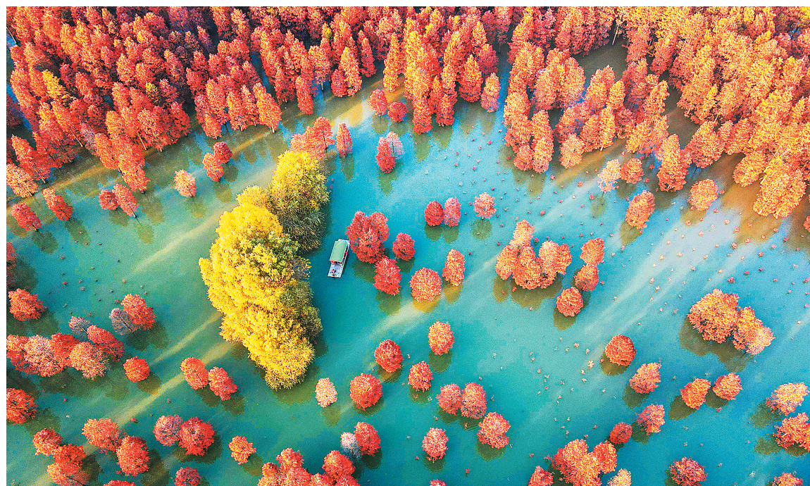
▲ 12月8日，空中俯瞰安徽省合肥市庐江县柯坦镇城池村大汉塘近万林池杉，层林尽染，林水交融。