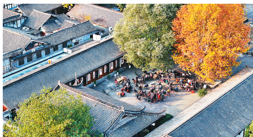
▲ 12月11日，在四川省阆中市阆中古城，金黄的银杏树、法国梧桐与古朴的民居院落相映成景。