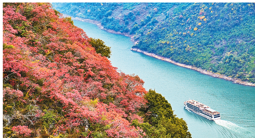
▲ 近日，位于重庆市巫山县的长江三峡巫峡两岸迎来最佳红叶观赏期，红叶似火，与一江碧水交相辉映。图为12月7日，游船行驶在巫峡江面上。