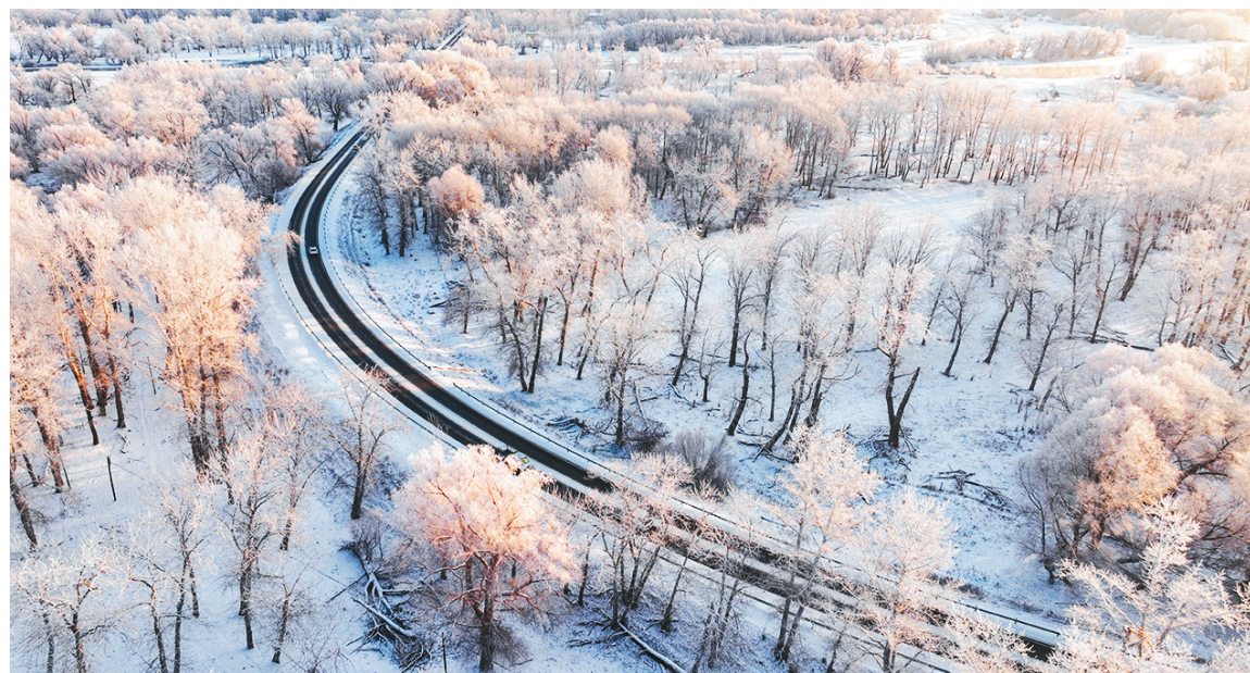
▲ 12月10日，新疆生产建设兵团第十师境内现额尔齐斯河雾凇景观。