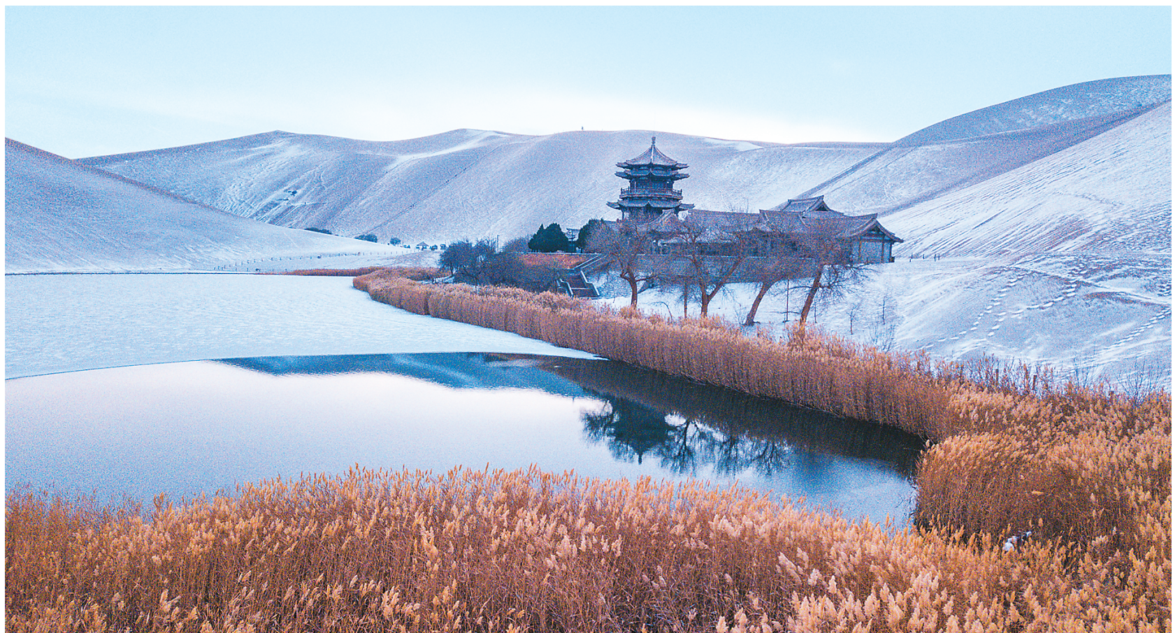
▲ 近日，甘肃省敦煌市迎来入冬以来的第二场降雪。雪后的鸣沙山月牙泉景区风景如画，吸引了众多游客前来观光游览。