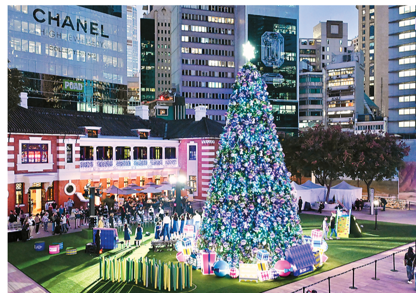
近日，香港中环大馆内推出12米高的巨型圣诞树装饰，为冬日增添色彩。图为大馆内的巨型圣诞树装饰。

本次文化节的启动活动在香港中环街市举行，现场设有多个展览及互动摊位，包括中医体质辨识、模拟中医馆和中医药工具及造型拍照区、冬季养生资讯展览，以及香港中医医院模型展览和游戏等，让市民以富趣味性的方式体验中医药文化特色。活动也安排了多场中医药专题讲座，主题涵盖中医药国际化、中医药在基层医疗的角色、中医与精神健康、趣味中医药科普和中医无国界义诊经验等。