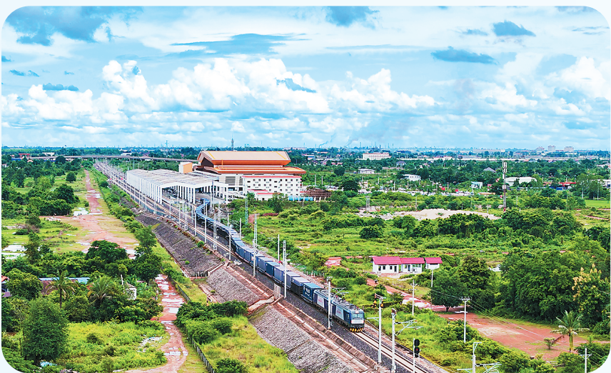
满载货物的列车驶出老挝万象站，向中国昆明进发。

的重要通道。”日本《日经亚洲》报道称，老挝泰国跨境铁路客运列车今年开通运行，与中老铁路实现了“无缝衔接”。尽管泰国和中国互不接壤，但铁路实现了中老泰相连接，促进了跨境物流和贸易。