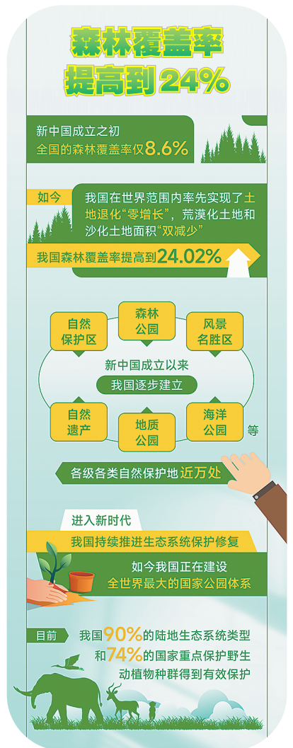
上图：宋博制图 左图：江西省萍乡市萍水湖湿地公园，景色如画。