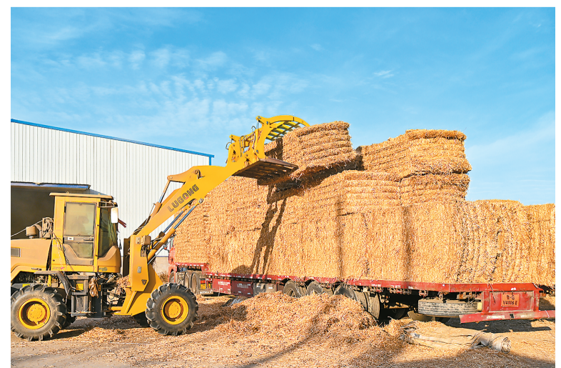
近年来，安徽省亳州市谯城区古城镇持续推进小麦、玉米等秸秆饲料化、肥料化和基料化，变“废”为“宝”，促进农业绿色循环发展和生态环境质量改善。图为日前，在古城镇后许村秸秆收储场，工人在装运销往甘肃等地的畜牧秸秆。

邯郸税务部门与当地财政、市场监管等部门强化合作，为符合以旧换新政策条件的新能源汽车销售企业量身定制优惠政策服务包和发票服务；运用“税直达—4R”税费服务机制，精准匹配、推送政策给适用的主体，并通过电子税务局、直播课堂、征纳互动平台、税企交流群等多种渠道，宣传解读优惠政策；各地推出预约服务、绿色通道、延时服务、现场辅导等多项便民办税服务举措，让纳税人更加便捷享受优惠政策，助力以旧换新政策落地见效。