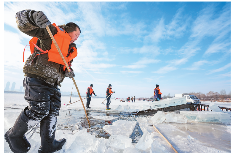
眼下，“冰城”哈尔滨采冰工作全面展开，采冰汉子从松花江上采出优质冰料，源源不断地运往冰雪大世界园区等地，用于景观建设。图为12月9日，工人在松花江哈尔滨段采冰。

国家发展改革委联合有关部门，按照自上而下的原则，对项目进行严格筛选，优先选取跨区域、跨流域重大标志性工程，努力确保所有项目都体现“两重”性质和国家意志。“两重”建设重点支持了长江沿线铁路、干线公路、机场建设、西部陆海新通道建设，东北黑土地高标准农田建设、“三北”工程建设，农业转移人口市民化公共服务体系建设，高等教育提质升级等领域建设。