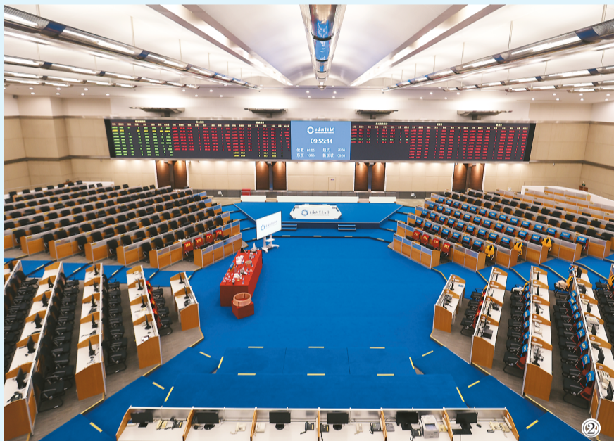
图②：图为上海期货交易所期货交易大厅内景。