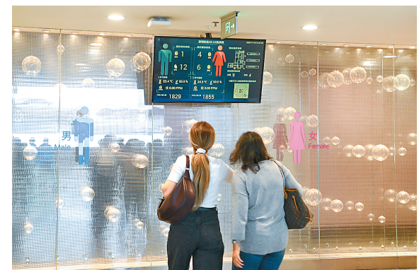
这是11月10日在深圳机场拍摄的智慧导厕系统。人们可以在卫生间门口的大屏幕上实时查看厕位空余情况以及周边公共卫生间信息。