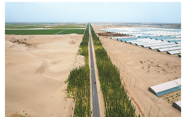
在新疆和田地区和田县拍摄的防护林带，道路两边是沙漠饲草基地和设施农业基地（6月20日摄，无人机照片）。