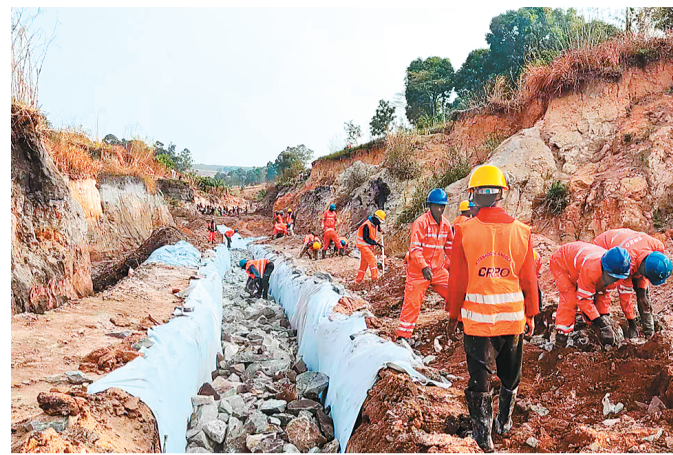
▲ 中铁二十局抢险队在垮塌路段进行地下导流沟施工。