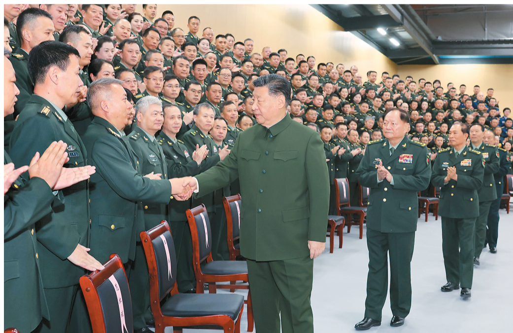
十二月四日,中共中央总书记、国家主席、中央军委主席习近平视察信息支援部队,代表党中央和中央军委,对信息支援部队官兵致以诚挚问候。这是习近平同代表们亲切握手。