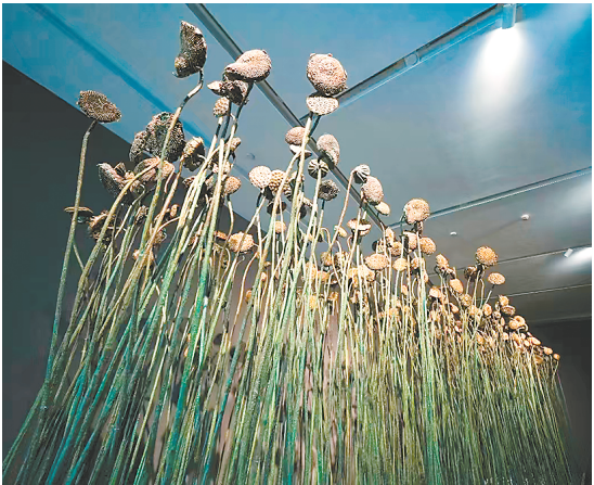
现场展出的许江雕塑作品《共生会否可能?》。

据悉，今年8月，中国美术学院与威尼斯双年展签署了为期3年的谅解备忘录，本次展览是其首个合作项目。