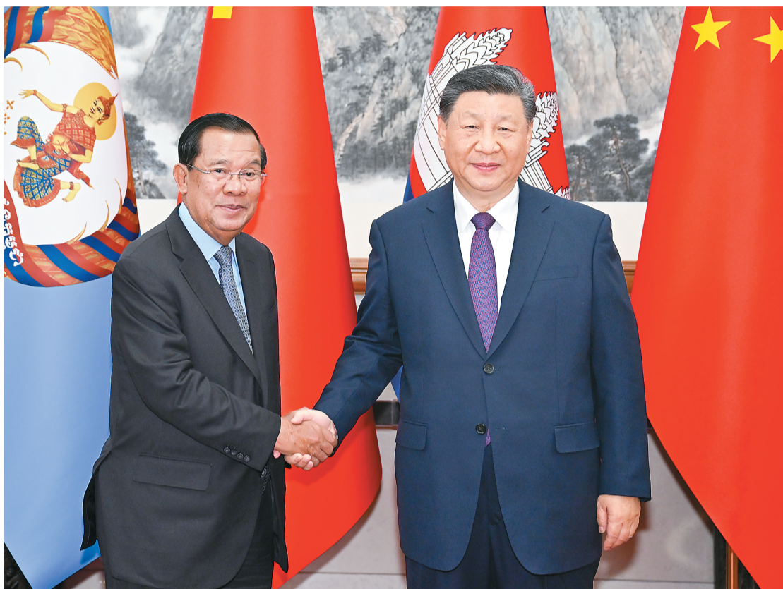
十二月三日,中共中央总书记、国家主席习近平在北京钓鱼台国宾馆会见柬埔寨人民党主席、参议院主席洪森举行会谈。

本报北京12月3日电 (记者李欣怡) 12月3日,中共中央总书记、国家主席习近平在北京钓鱼台国宾馆会见柬埔寨人民党主席、参议院主席洪森举行会谈。 习近平表示,中柬铁杆友谊成色十足,完全符合两国人民共同利益。中方始终将柬埔寨作为周边外交重点方向,愿同柬方携手打造高质量、高水平、高标准的新时代中柬命运共同体。双方一要坚定相互支持,巩固铁杆友谊。中方将坚定支持柬埔寨维护国家主权、安全、发展利益。二要深化交流互鉴,共谋发展振兴。中国共产党愿同柬埔寨人民党加强战略沟通和干部培训合作,