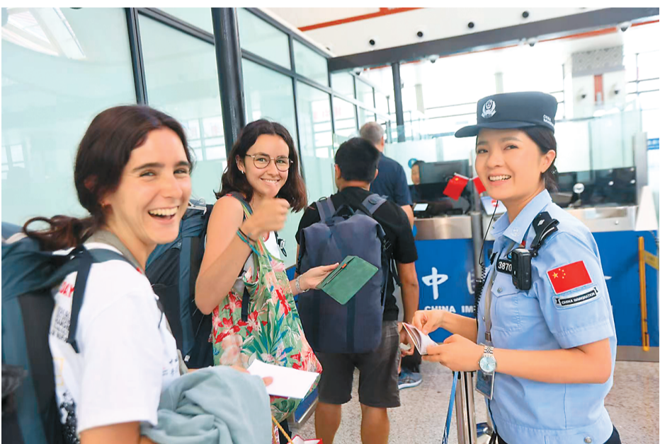
7月19日,两名在中国读书的阿根廷留学生,暑期乘坐中老铁路由中国出境到老挝旅游。图为她们在磨憨铁路口岸与工作人员合影。

“货运贸易往来不停,外国旅客也赞不绝口。”日本共同社近日报道称,“在老挝边境城市磨丁,流线型的现代化列车在