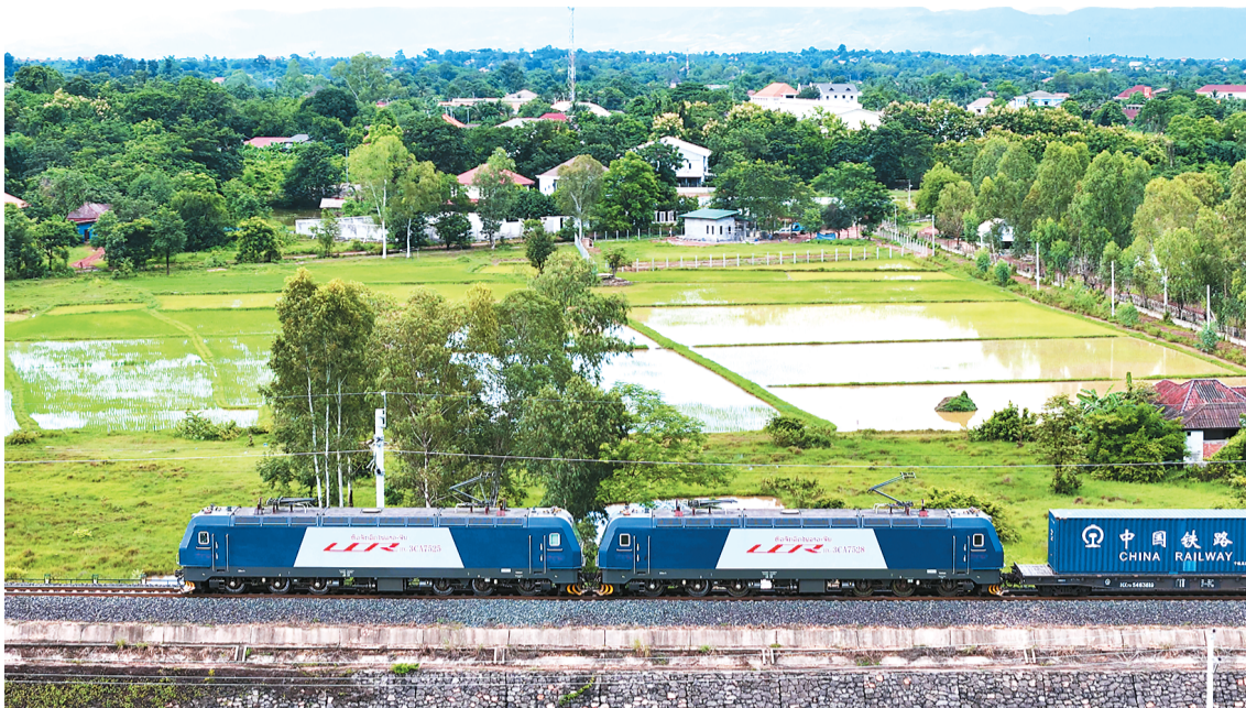
中老铁路奔驶,这是东南亚国家与中国旅游和贸易联系日益紧密的一个缩影。

“铁路一通,昆明到万象从此山不再高、路不再长。”随着中老铁路人气更旺,“带货”更强,更多互利共赢的故事还在书写。