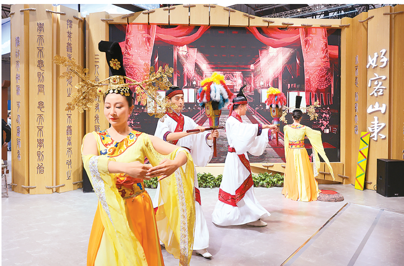
演职人员在山东省展台上表演舞蹈。