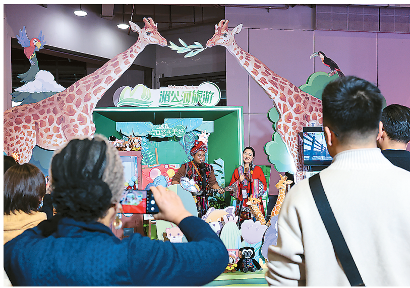
参观者在云南滇池河旅游展台观看文艺演出。

颇为吸睛,现场利用可穿戴VR设备,营造古蜀文明“穿越之旅”。一位体验了《奇遇三星堆》VR沉浸探索展的俄罗斯参展人员称赞“特别酷”,“看完更想去四川了”。