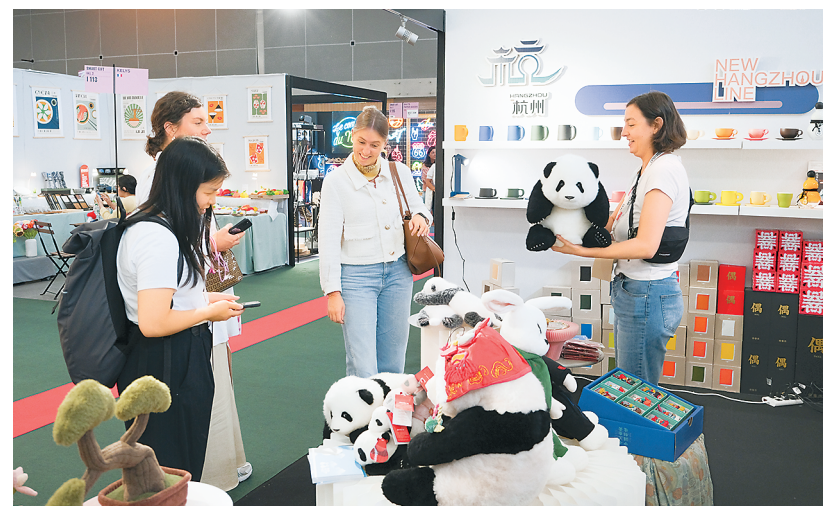
2024巴黎设计周上,外国观众在欣赏高仿真大熊猫玩偶。

四川省境内的路线包含成都大熊猫繁育研究基地、都江堰、广元剑门关、雅安碧峰峡等点位;陕西省境内的路线包含佛坪熊猫谷景区、陕西考古博物馆、秦岭野生动物园、秦岭四宝科学公园等点位;甘肃省境内的路线包含文县尖山大熊猫自然保护区、兰州水墨丹霞景区、武都万象洞、宕昌草原等点位。该特色旅游线路的推出,适应了文旅融合发展新趋势,不