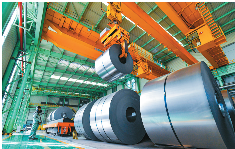
河北省承德市双滦区加快发展钒钛制品及特色制造业，生产的钒钛新材料产品应用于高端家电、五金等行业。图为双滦区美富冶金镀锌产线车间，智能天车在吊运铝铝板材。

——部分重点行业PMI稳中有升。从重点行业看，高技术制造业和消费品行业PMI分别为51.2%和50.8%，比上月上升1.1和1.3个百分点，景气度均有回升；装备制造业PMI为51.3%，与上月持平，相关行