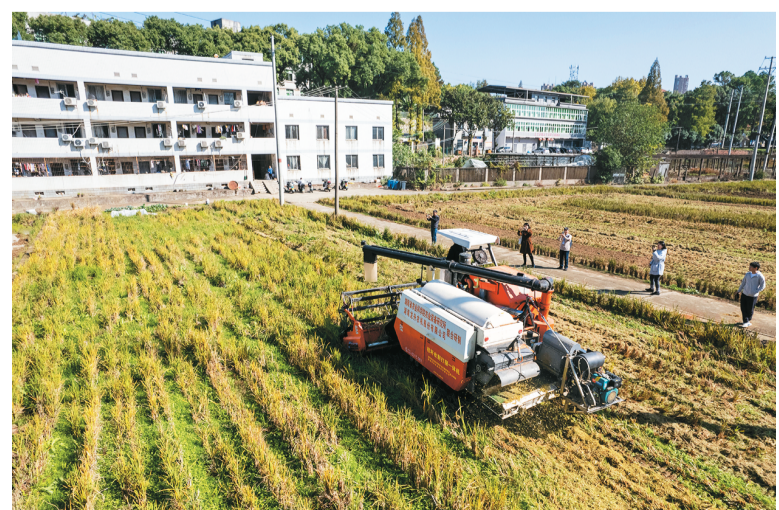
湖南省发挥工程机械国家先进制造业集群优势，支持相关企业开展技术攻关及研发创新，不断优化农机在农业社会化服务中的作用，加速推动湖南从传统农业向现代农业的转变。2023年，全省水稻耕种收全程机械化率达83.46%。图为湖南省农业装备研究所东湖路试验田里的秸秆收割打捆一体机在工作。

除主论坛外，论坛包括三个平行单元，围绕“中国式现代化中的城市管理与发展”“人才强国建设背景下的财商素养教育”和“深化农村金融改革，走好特色金融发展之路”三个议题开展专题研讨。