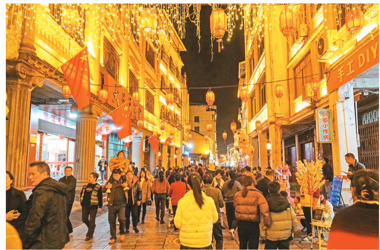
今年以来，广西壮族自治区柳州市融安县通过文旅融合，积极打造夜间文化和旅游消费集聚区，以夜经济点亮文旅发展新“夜”态，拉动消费市场持续升温。图为融安县长安镇骑楼老街灯火璀璨，精彩纷呈的沉浸式互动演出和非遗表演，让游客近距离感受骑楼文化的魅力。

据介绍，该局的成立运行是加快建设具有世界影响力的中国特色自由贸易港的重要举措。《海南自由贸易港建设总体方案》发布以来，海事部门积极开展海南自由贸易港国际船舶登记制度改革创新，海南全岛新增航运类主体近700家，新登记或转籍“中国洋浦港”船舶47艘，新增国际运力533.21万载重吨，海南航运业蓬勃发展，各类航运要素正加速集聚。