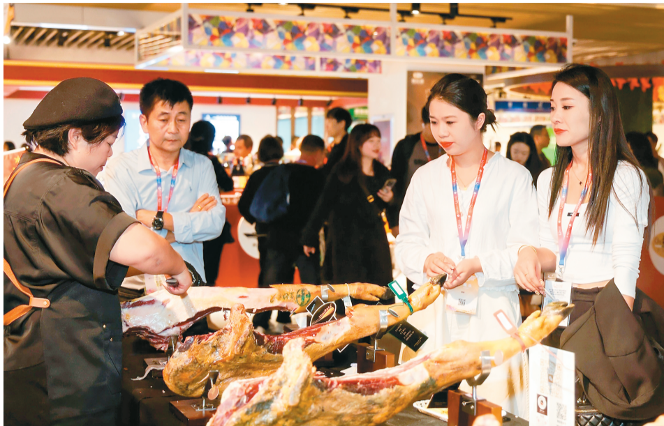
图为第六届侨博会现场。

热闹的展会现场，侨商们的身影格外活跃。他们寻找机遇，洽谈合作，牵线搭桥，促进中外好物互通共享，助力侨博会成为“买全球、卖全球”的优质平台。