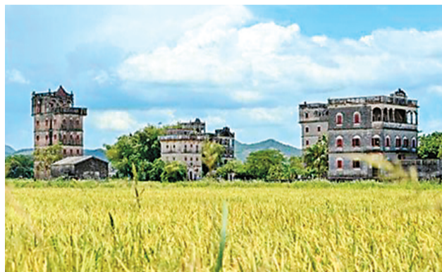
图为广东省开平市自力村内的稻田与四周的碉楼相映成趣。

在侨乡广东开平，矗立在乡野间的上千座中西合璧的碉楼，在曾经动荡不安的岁月里给了开平人一个安居的梦，至今仍牵动着海外侨胞的思乡情。