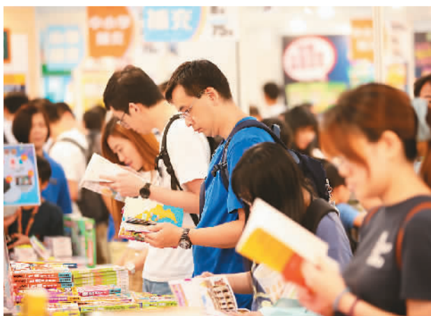
图为香港市民在去年书展上阅读书籍。

人潮高峰时段参观书展。对于无法到场的读者，香港贸发局特别投入资源在书展网站增设“文化线上行”专区，网罗一系列线上阅读、博物馆展览及文化活动内容，让读者不受时间和地域限制享受阅读乐趣。书展期间，主办方还将同期推出“运动消闲博览”，为到访人士提供各式运动、休闲产品和服务。在为期7天的展览之外，香港贸发局还将在6月底至7月底携手多个图书馆、博物馆、文化教育机构在全港各区举办不同类型的文化活动，让全港市民感受阅读乐趣。