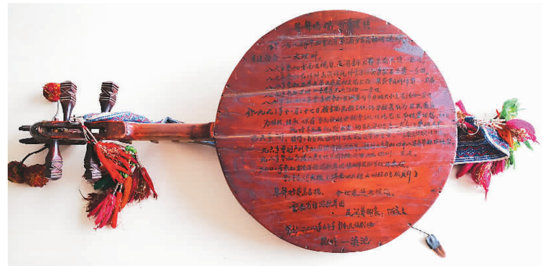
伴随阿家文时间最长的四弦琴，琴板背面记录着他的演艺经历。

民族艺术本就源于生活。随着社会变迁，吃火草烟等风俗式微，四弦琴在年轻人中不再流行。“能够完整弹下整套曲调的人已经不多，过去为唱跳伴奏的四弦能省则