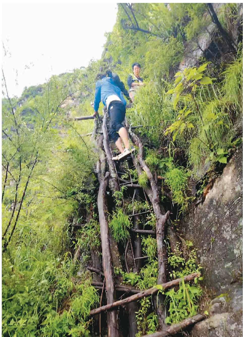
2015年夏天拍摄的悬崖村藤梯。当时，进村要爬17条藤梯，多处梯子倾斜60度以上，最险的一段接近90度，几乎紧挨着悬崖。