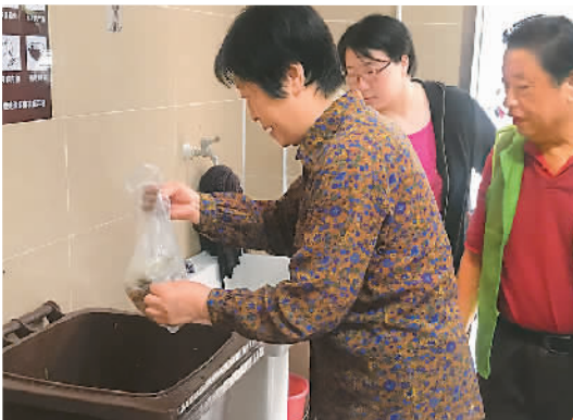
上海市静安区会文大楼小区居民在分类投放垃圾。