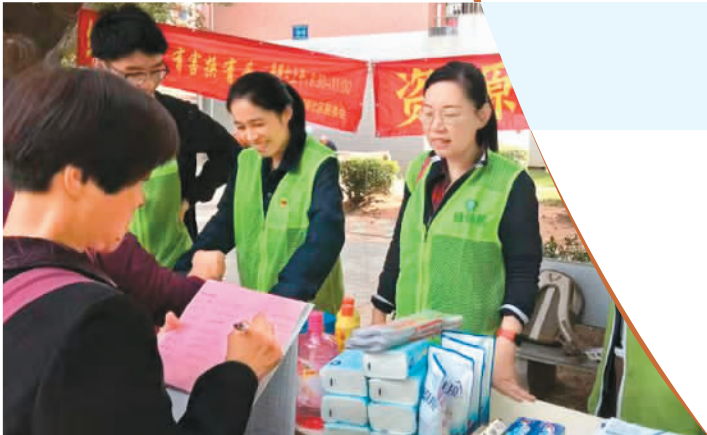
福建省厦门市思明区莲前街道前埔南社区古兴里小区垃圾分类“绿色星期六”活动现场。

调、培训宣传、督导考评等4个方面，各部分工作要均衡发展。对于一些城市社区聘请第三方社会组织进行运营保障，投入大量资金招聘人员进行二次分拣而忽视其它工作，黄厚新认为并不可取，“一旦地方财政等资金无法持续投入，垃圾分类系统就容易出现倒退，甚至崩溃。因此，要更大限度发挥社区力量、利用社区条件，支持参与构建可持续的社区垃圾分类系统。”