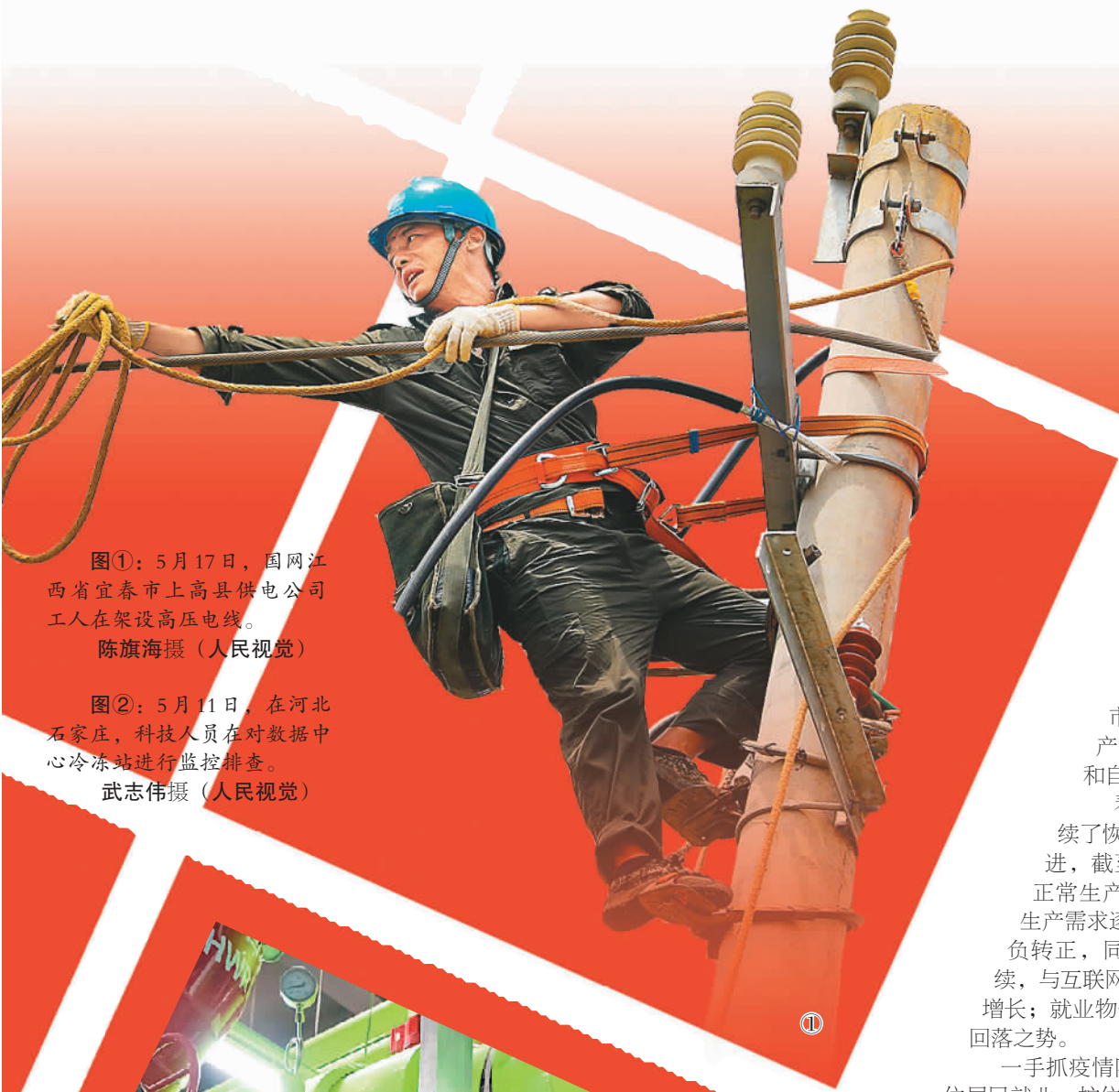
图①：5月17日，国网江西省宜春市上高县供电公司工人在架设高压电线。