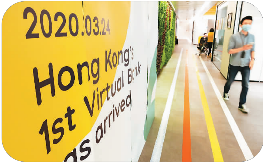
▲ 香港首家“虚拟银行”众安银行。