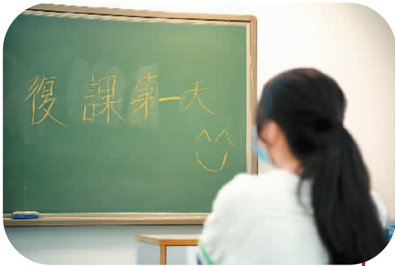
▲ 5月4日，澳门教业中学学生在教室里上课。