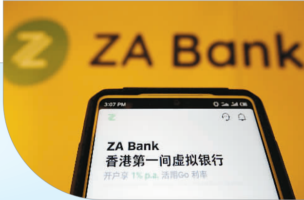
▲ 众安银行手机软件页面。

银行，刚刚度过正式营业的“满月”期。香港金融管理局如此评价：首家虚拟银行投入运营不仅意味着银行用户能够体验到更多创新，也标志着香港银行业迈进一个新的里程。