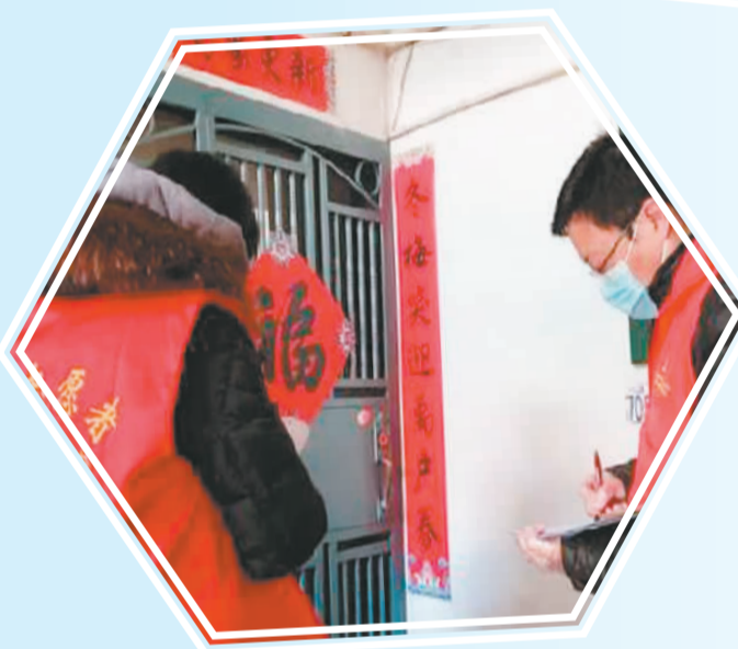
▲ 太原海归青年志愿者参与社区居民防疫信息排查。