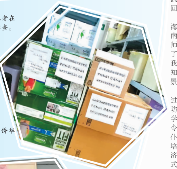
▶ 卢森通通过海外华侨华人组织联系到的捐赠物资。