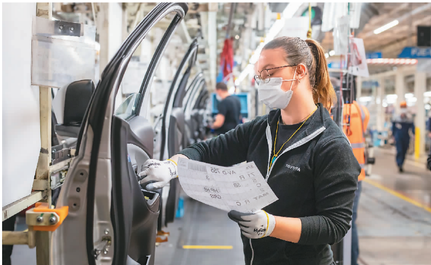
4月28日，工人在位于法国瓦朗西安纳的丰田汽车公司车间工作。位于法国瓦朗西安纳的丰田汽车公司4月23日开始逐渐复工。工人在工作过程中需要佩戴口罩，并在车间、办公室和休息室保持社交距离，公司为工人提供自制防护面罩及消毒免洗手液等防护用品。