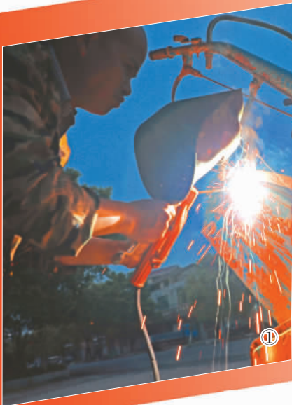
图①：4月8日，在江西省吉安市泰和县马市圩镇，维修人员趁夜抢修农机，保障农户春耕生产。

工复产快速推进。每位投身其中的劳动者，也都在为社会生活恢复正轨贡献着自己的力量。在“五一”劳动节来临之际，我们来看一看劳动者们的复工故事。