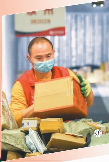
图③：3月23日晚，湖北省荆州市浩瀚物流园内的一家快递公司分拨中心，返岗员工在连夜分拨快件。 图④：4月25日，湖南省永州市道县一家电子商务公司的销售员通过直播卖夏橙。