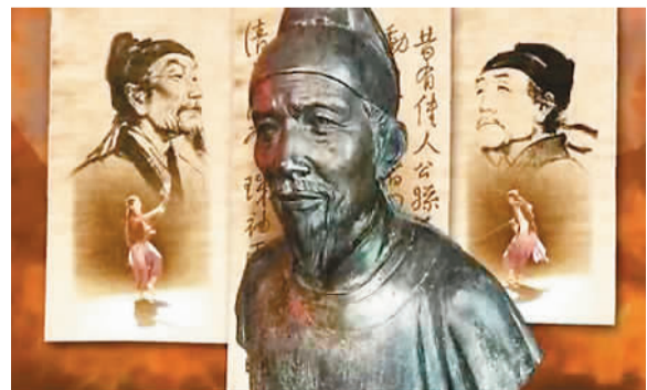
BBC(英国广播公司)推出的纪录片《杜甫：中国最伟大的诗人》截图

中国作家协会《诗刊》社微信公众号“中国诗歌网”，是国内较早报道BBC播出《杜甫》的新媒体。《诗刊》社相关人士说，中国诗歌网微信号和诗刊社微信号发布的有关消息，仅两天阅读量就达到10万+。他认为，这一现象被广泛关注，与杜甫作为诗歌的标尺性人物以及人们对他的爱国思想、人民性和悲悯情怀的广泛认同有关。杜甫史称“诗圣”，“读杜甫的诗，让人感到来自历史深处的一种温情、博爱与力量。”《诗刊》社相关人士表示，“这次疫情，更让人深刻感受到人类是一个命运共同体。杜甫的伟大是超越时空与地域的。”