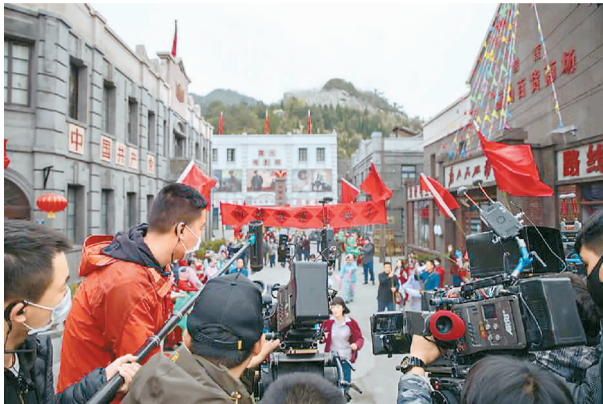
《妈妈在等你》剧组在横店影视城拍摄

2018年6月动工的横店影视产业园项目，设有29个国际标准高科技摄影棚，包括一座全球面积最大的摄影棚，全部项目计划在2022年完工。此外，横店正在加快打造国内知名编剧村、制片人村和导演村。正在筹建的横店电影学院被列入“浙江省‘十三五’时