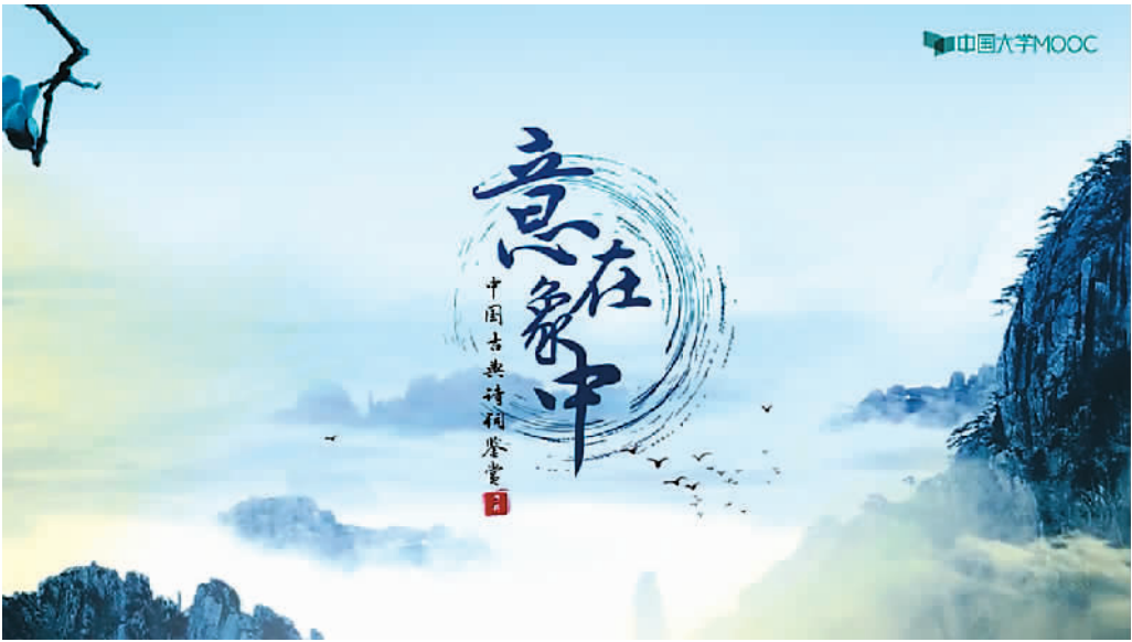
北京师范大学开设的慕课《意在象中——中国古典诗词鉴赏》视频截图