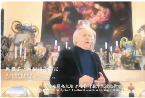
音乐电视《在一起》视频截图：意大利歌唱家阿曼多·阿里奥斯蒂尼在家中录制歌曲