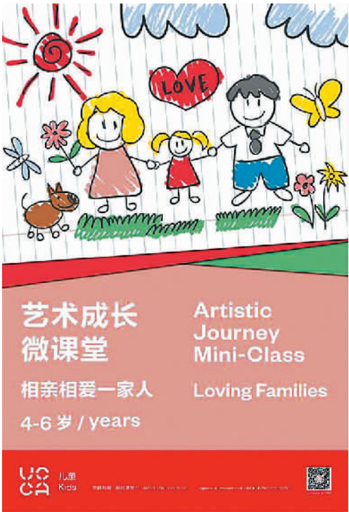
UCCA尤伦斯当代艺术中心儿童艺术成长微课堂海报 图片来自UCCA儿童微信公众号

海。的确如此。相信疫情之后，线上艺术教育凭借自身优势，仍将与我们同行。一部分热衷于线上教学的艺术爱好者将被沉淀出来，也会有大量学生用慕课来完成艺术选修学分或选修国际艺术院校学分课程、学历教育。同时，越来越多的传统艺术课程会选择线上线下混合式教学，艺术机构也将更加重视线上公共艺术资源建设，还会有更多社会培训机构选择线上艺术课程+文旅等众多衍生模式。