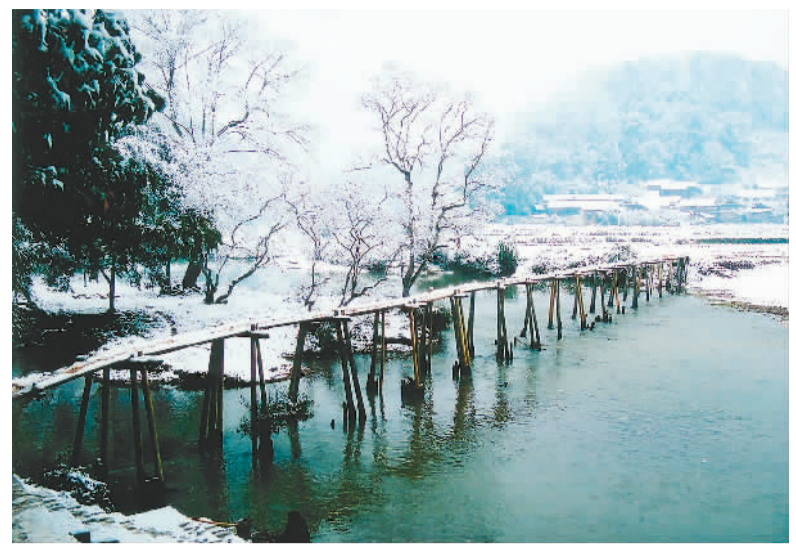
图为黎平少寨红军桥。1934年12月，红军长征经过少寨，当地群众为红军搭建了此桥。

●重点联合展示资源：黔东特区革命委员会、息烽集中营等其他重要革命历史遗迹；长征沿线反映少数民族文化（苗族、侗族等）的传统聚落；赤水河谷、鸡鸣三省大峡谷、乌蒙山等反映沿途自然地理特征的自然资源；赤水河沿岸反映传统酿酒技艺的系列历史遗存；茅台镇、土城镇等历史文化名镇；茅台为代表的酒文化相关的历史遗存；茶马古道及沿途重要驿站、村镇。