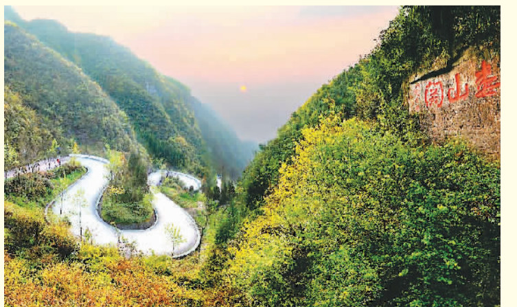
图为著名的茶马山关。