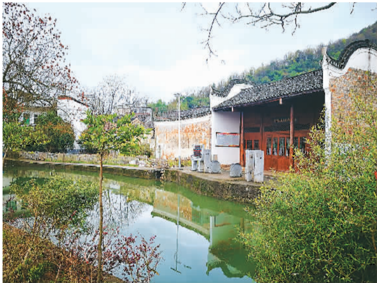
图为红军长征湘江战役中新圩阻击战地救护所旧址。

“文化线路”遗产保护理念，强调价值的整体性：整体价值大于单体之和。长征历史遗存，体现的正是这种“1+1>2”的整体性价值，每一个单体都如同蕴藏着独特历史信息和历史细节的拼图，以整体视角看去，呈现出的是全景式的长征故事。