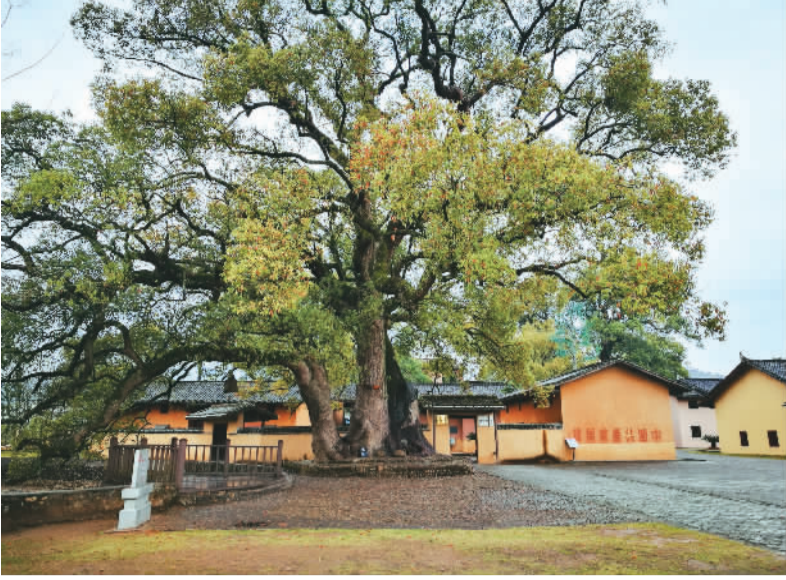
图为瑞金沙洲坝革命旧址群。

长城和大运河已分别于1987年、2014年被列入世界遗产名录，其遗产价值、构成要素、保护传承理念已在国内外形成高度共识。而将长征历史遗存作为一个遗产体系进行整体保护、利用，则面临全新的挑战。