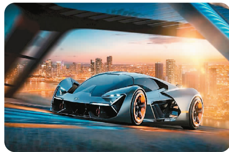
发展清洁能源车辆是全球大势。图为电动车设计概念图。

黄锦星介绍，特区政府将拨款20亿港元资助私人住宅停车场安装电动车充电基础设施，该计划将在今年下半年推出，目标是3年内能令约6万个停车位受惠。初步计划资助购置全新电动公共小巴和建造充电设施，目标包括约40辆行走不同路