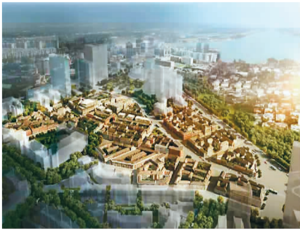
左图：2020年2月，大连市东关街历史文化街区被辽宁省人民政府公布为省级历史文化街区。街区总面积8.13公顷。图为东关街历史文化街区规划效果。