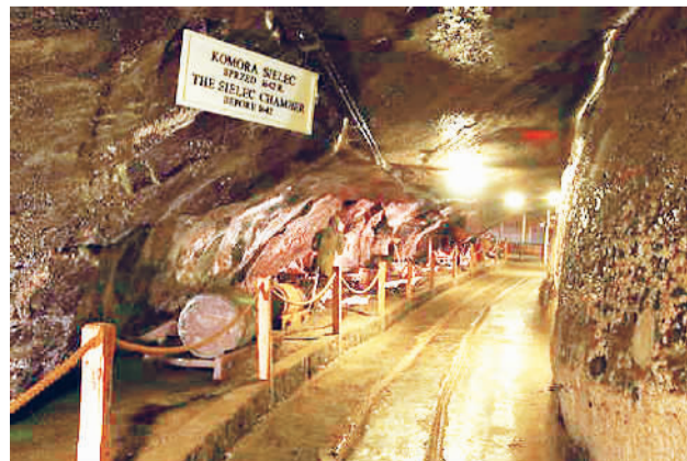
这是位于波兰的世界文化遗产维奇利卡和博赫尼亚皇家盐矿。由于安全、环境保护等原因，一些有意义的矿洞、矿山等工业场所不能经常向公众开放。通过线上展陈，则可远程访问。