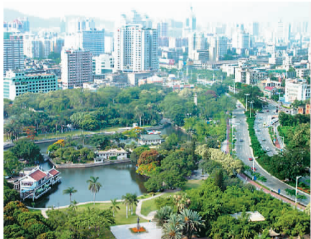
左图：厦门拥有丰富的历史文化资源。图为厦门中山公园。