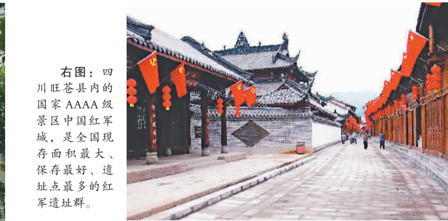
右图：四川旺苍县内的国家AAAA级景区中国红军城，是全国现存面积最大、保存最好、遗址点最多的红军遗址群。