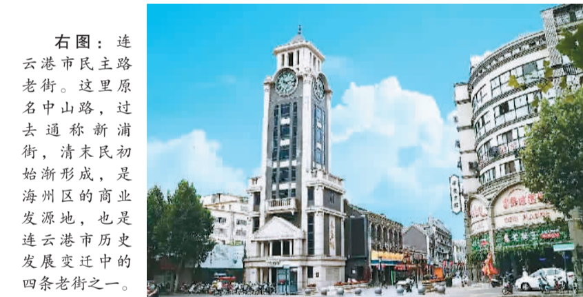
右图：连云港市民主路老街。这里原名中山路，过去通称新浦街，清末民初始新形成，是海州区的商业发源地，也是连云港市历史发展变迁中的四条老街之一。