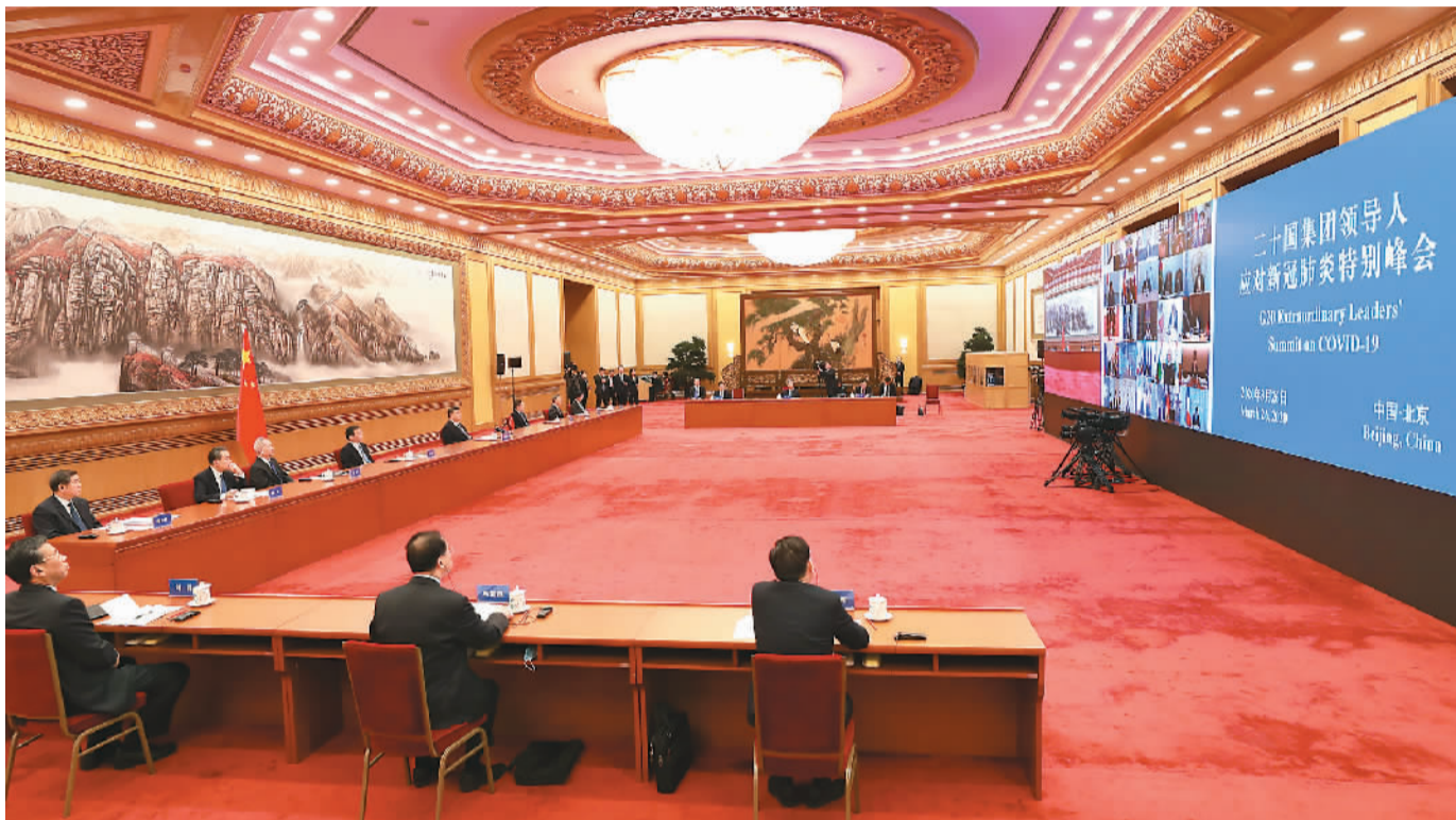
3月26日, 国家主席习近平在北京出席二十国集团领导人应对新冠肺炎特别峰会并发表题为《携手抗疫 共克时艰》的重要讲话。

本报北京3月26日电 (记者王远) 国家主席习近平26日晚在北京出席二十国集团领导人应对新冠肺炎特别峰会并发表题为《携手抗疫 共克时艰》的重要讲话。习近平强调, 面对突如其来的新冠肺炎疫情, 中国政府、中国人民不畏艰险, 始终把人民生命安全和身体健康摆在第一位, 按照坚定信心、同舟共济、科学防治、精准施策的总要求, 坚持全民动员、联防联控、公开透明, 打响了一场抗击疫情的人民战争。经过艰苦努力, 付出巨大牺牲, 目前中国国内疫情防控形势持续向好, 生产生活秩序加快恢复, 但我们仍然丝毫不能放松警惕。当前, 疫情正在全球蔓延, 国际社会最需要的是坚定信心、齐心协力、团结应对, 携手赢得这场人类同重大传染性疾病的斗争。中方秉持人类命运共同体理念, 愿向其他国家提供力所能及的援助, 为世界经济稳定作出贡献。