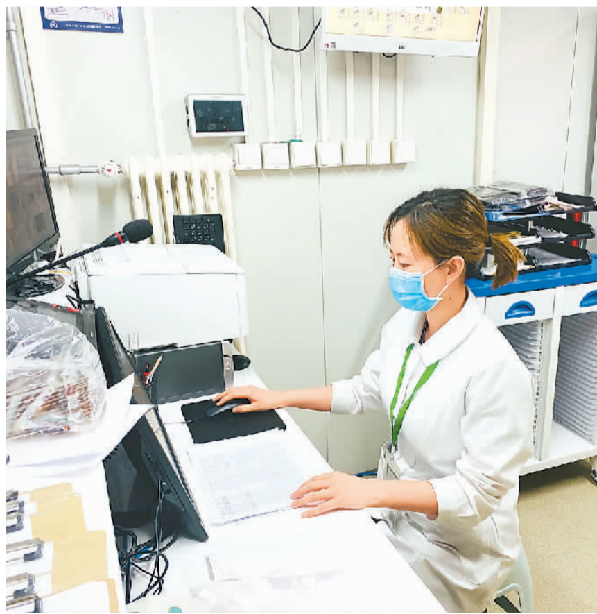
图为医疗队员在调试设备。