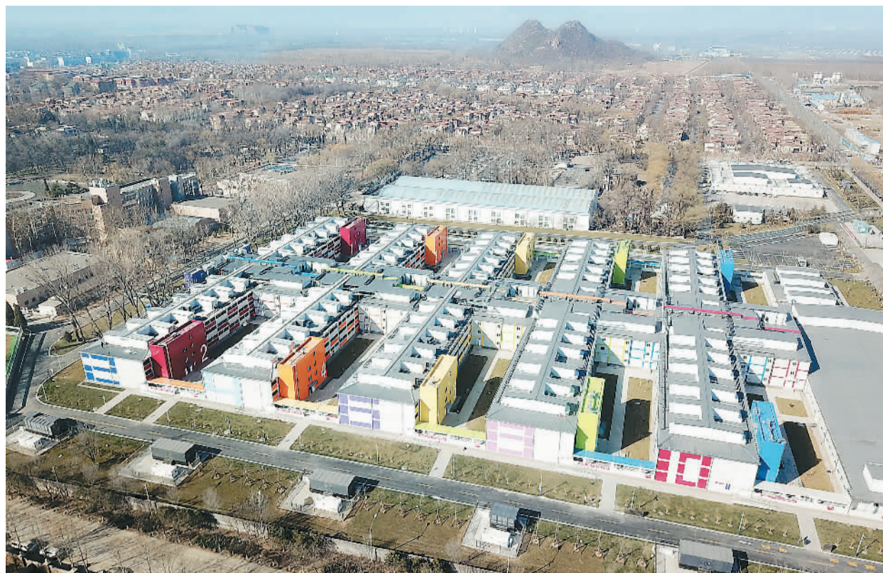
图为3月17日拍摄的北京小汤山医院局部（无人机照片）。

北京从市属医院中选派了数百名医护人员，专业涵盖呼吸、感染、重症、急诊、儿科、中医、检验、放射、药剂等，已完成系统的业务及防护培训。小汤山医院已与其他市级新冠肺炎救治定点医院形成远程会诊机制，促进医疗协同，分享经验。