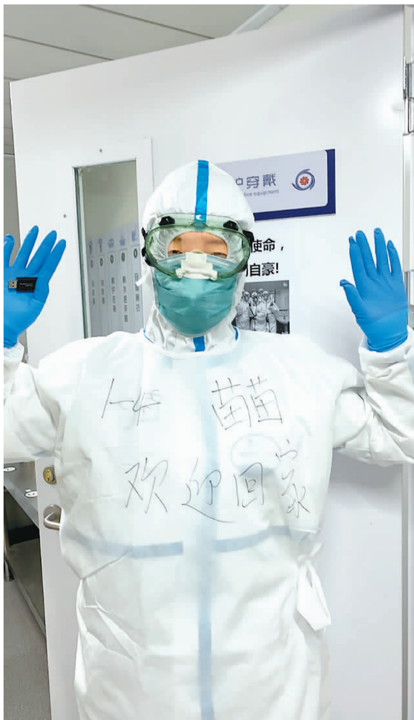
图为一名护理人员在防护服上写下“欢迎回家”的字样。