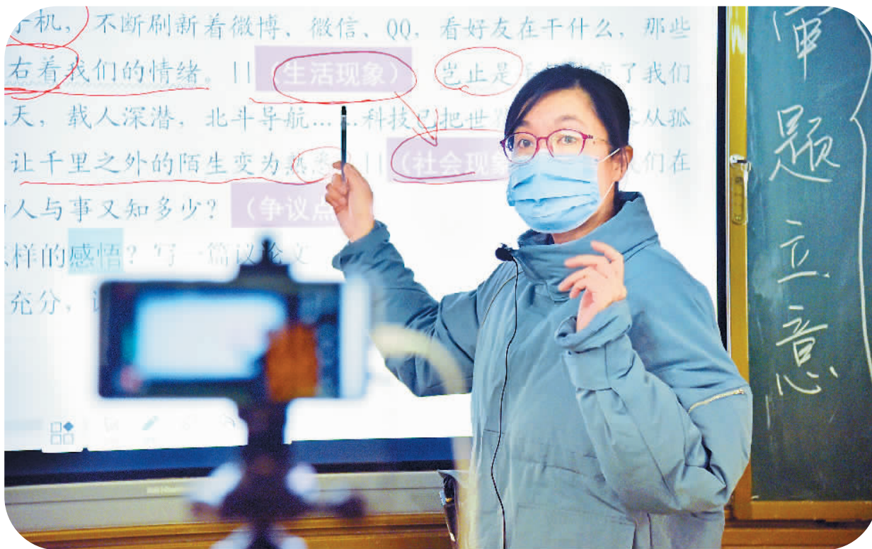
3月7日，在山东省曲阜市第一中学，高三语文老师为学生录制试题难点解析课程。