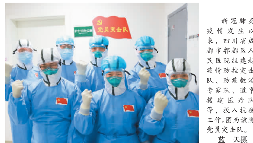
新冠肺炎疫情发生以来，四川省成都市郫都区人民医院组建起疫情防控突击队、防疫救治专家队、道孚援建医疗队等，投入抗疫工作。图为该院党员突击队。