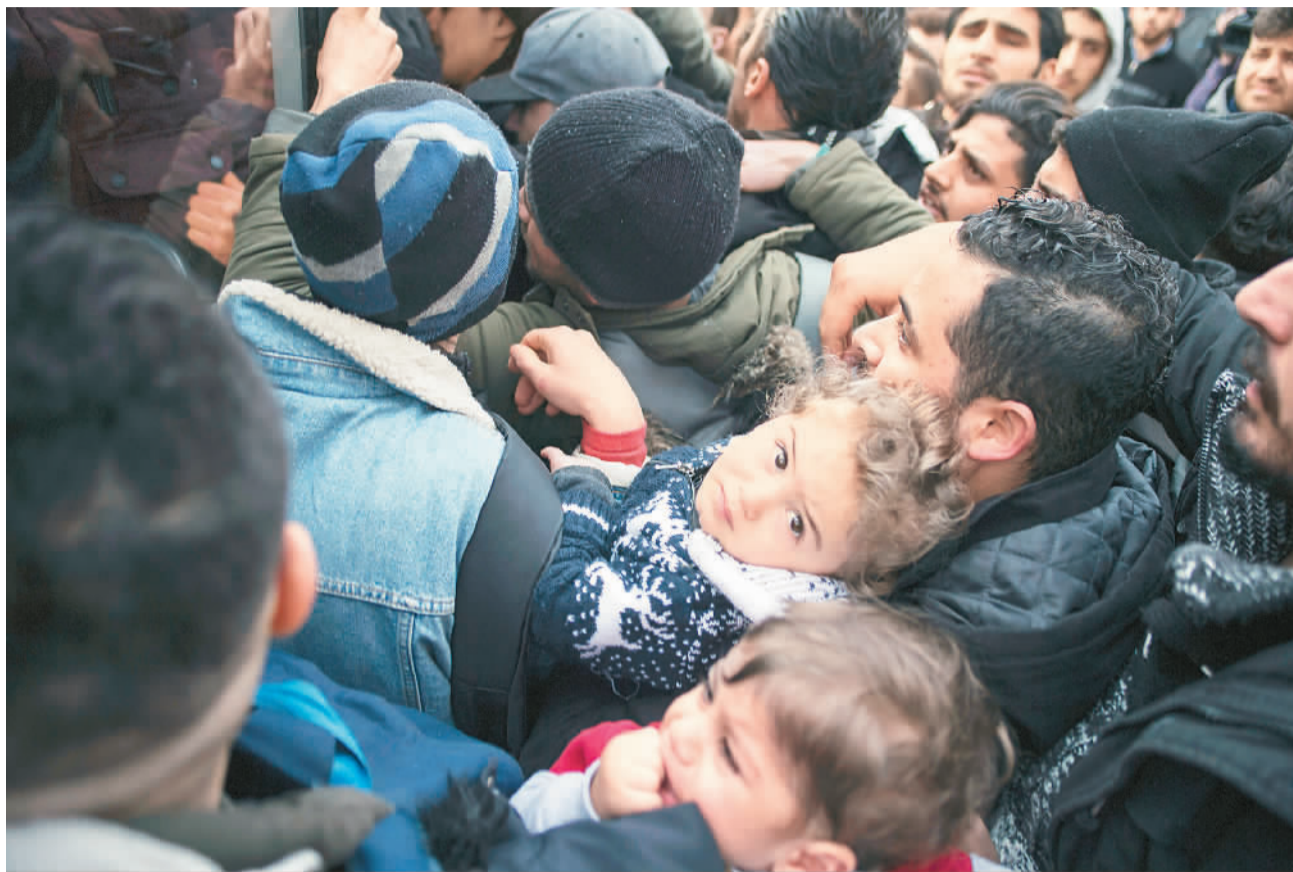
2月28日，在土耳其伊斯坦布尔，难民和非法移民试图登上前往土耳其与希腊边境的车辆。

据土耳其阿纳多卢通讯社消息，土副总统阿克塔伊近日会见了欧盟外交与安全政策高级代表博雷利一行，讨论叙利亚近期事态发展、伊德利卜人道主义危机及非法移民状况。据悉，土当局于2月28日表示，不再继续阻止移民和难民的流动，并开放了与欧盟的边界。数以万计滞留在土境内的难民和移民试图涌入欧盟。