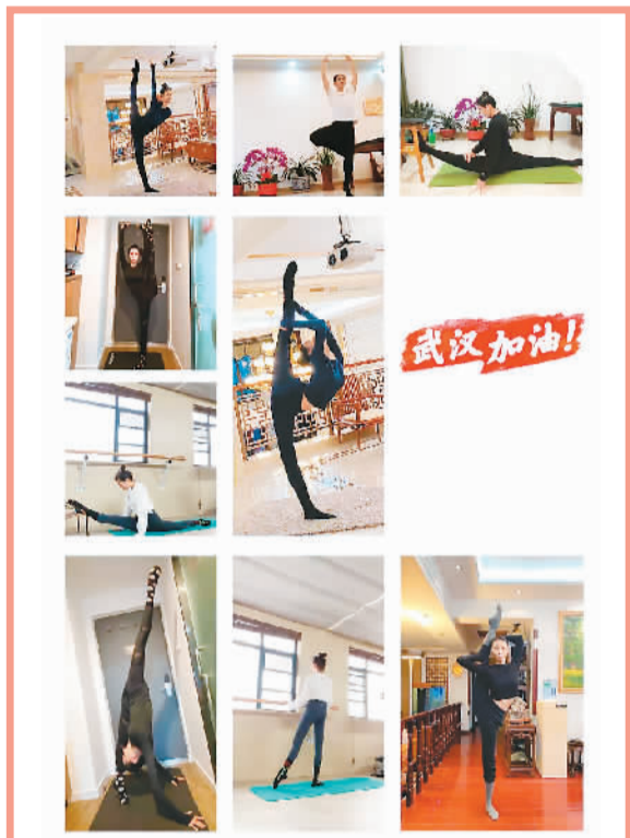
▲中国歌剧舞剧院演员居家练功

为降低演出机构的损失，全国200家剧场联名发布战“疫”承诺，将遵照不可抗力条款，退还演出定金；演出行业综合服务商大麦网宣布从佣金减免、金融扶持、提前退款等方面帮助合作伙伴共渡难关；北京、上海、浙江、重庆、山东、四川、黑龙江、河北等多地政府，出台相关税收优惠、房租减免、社保延