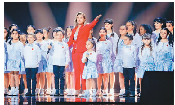
▲意大利安东尼亚诺儿童合唱团演唱《绝句》

儿》；华尔街投资大师吉姆·罗杰斯两个女儿再次作为经典传唱人，以标准中文生动演绎《西游记》唱段。这是当前全球各地兴起的“中文热”的缩影，也是中华文化在世界范围内更具风采的真实见证。