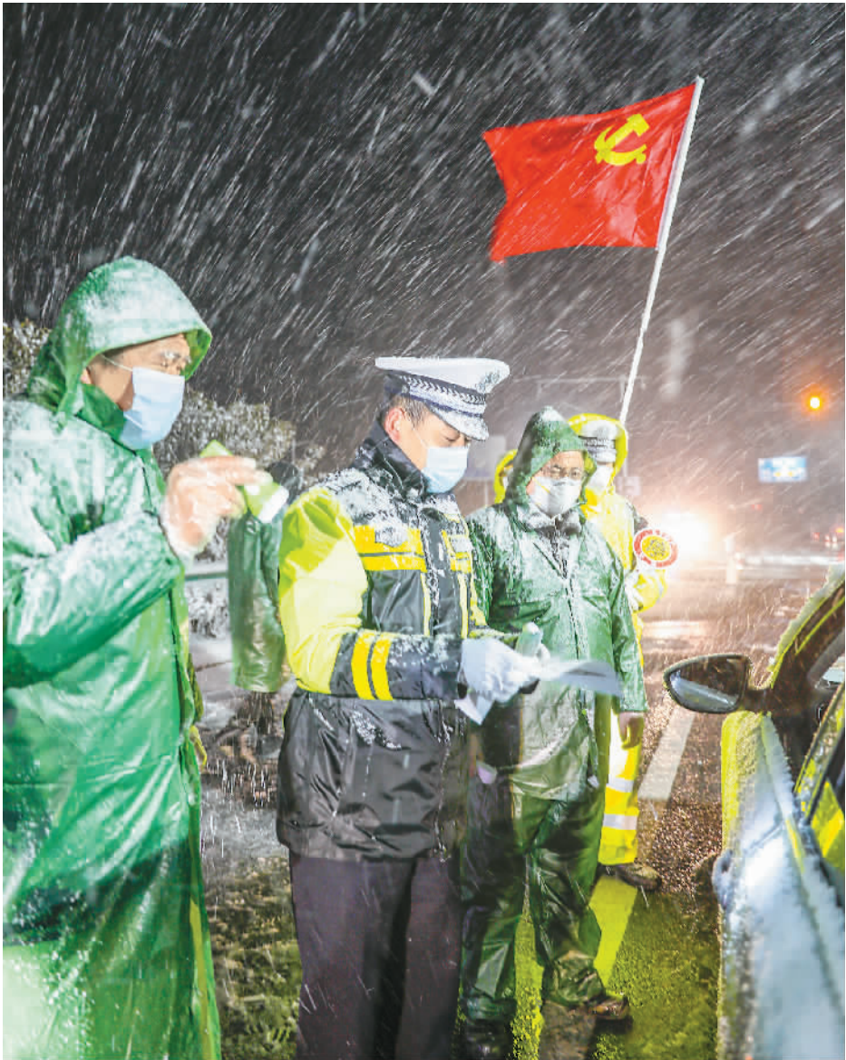
▲ 安徽省合肥市庐江县公安民警冒着风雪会同有关部门在同大疫情防控卡点检查车辆。