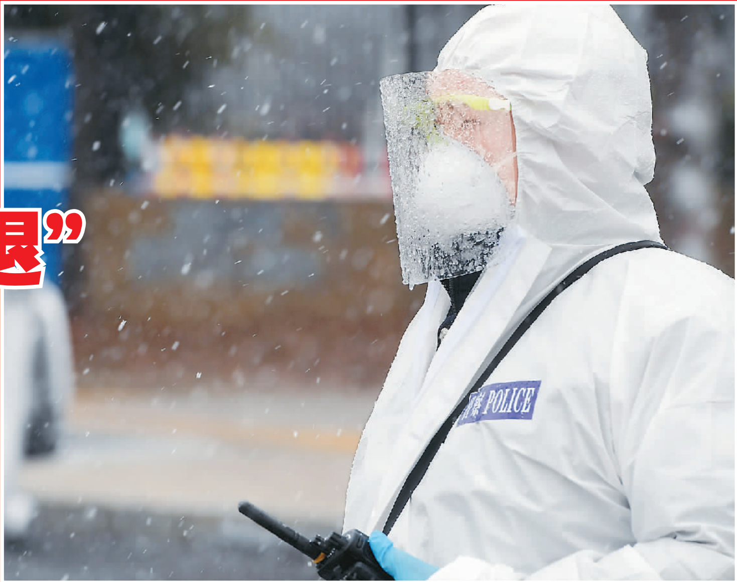
▲ 武汉市公安局东西湖区交通大队民警在武汉客厅方舱医院外冒雪值守。

疫情就是警情。面对来势汹汹的新冠肺炎疫情，中国公安机关和广大公安民警全力以赴投入到疫情防控和维护社会稳定各项工作中。 在机场、车站、高速出入口，公安民警风雨无阻，监测来往人员体温；在街道、社区，他们服务社区防控，落实联防联控措施，做好情况排查……哪里有困难，哪里就有警察出现；哪里有疫情，哪里就有警察战斗。 “疫情不退，我们不退。”这是公安民警面对疫情的铮铮誓言，也是他们在疫情防控一线的真实写照。