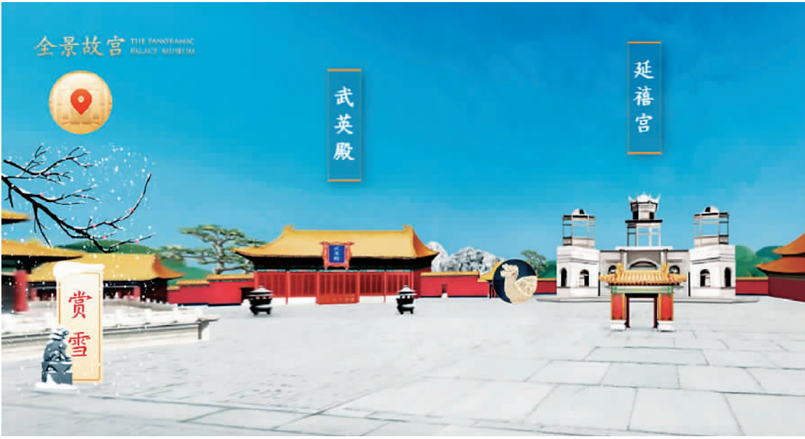
故宫博物院推出的“全景故宫”