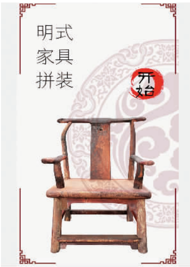
苏州博物馆“明式家具拼装”游戏

业内人士表示，这将推动新一代互联网技术发展成果应用于中华优秀传统文化的传播，有助于传统文明与现代文明相互融合。