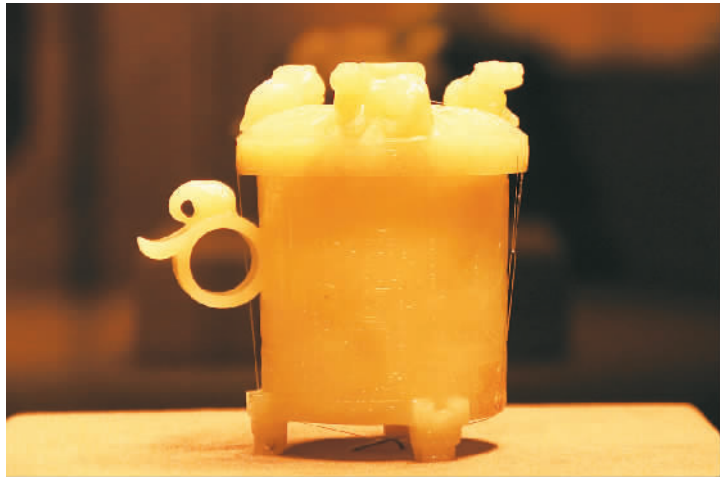
青白玉夔凤纹子刚款樽，首都博物馆藏