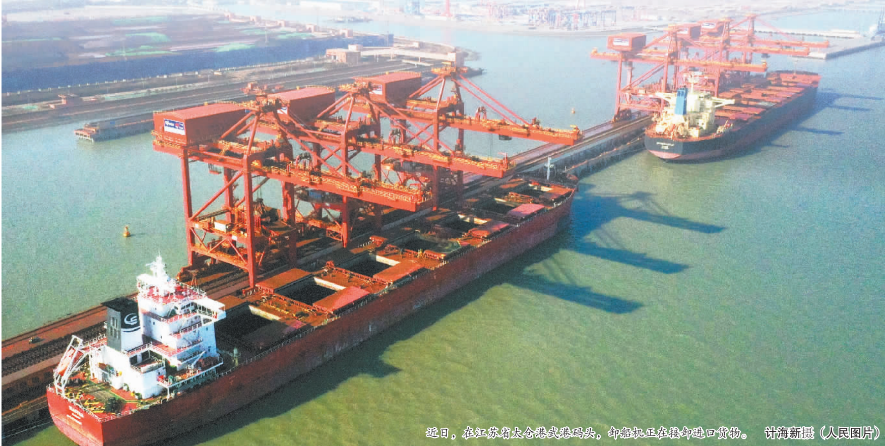
近日，在江苏省太仓港武港码头，卸船机正在接卸进口货物。

疫情防控物资进口，速度是关键。海关总署介绍，海关已在全国各通商口岸设立专门受理窗口和绿色通道，按照特事特办原则，为疫情防控物资提供便捷高效通关服务。对境外捐赠的疫情防控物资，先登记放行后补办减免税等手续。对专门用于疫情防控治疗的进口药品、医疗器械等，即到即提，确保通关“零延时”。在全国所有隶属海关设立咨询热线，并在主要媒体公布，专人负责值守，第一时间响应企业需求，解答问题，指导办理通关业务。