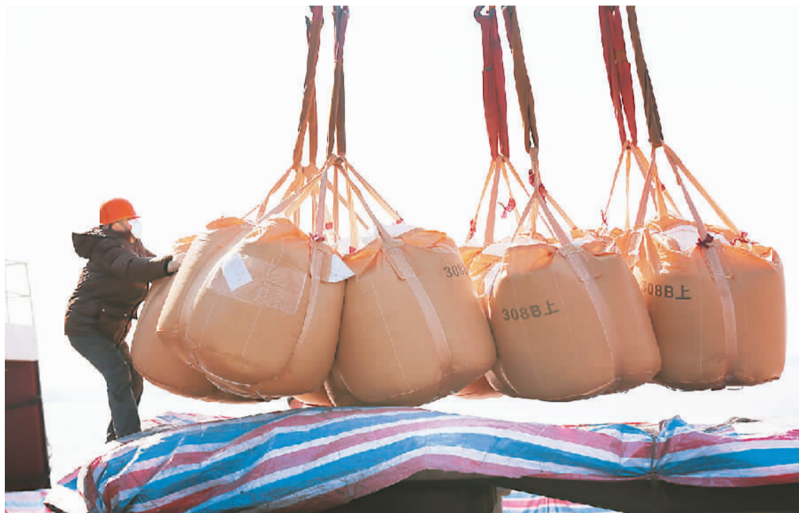
日前，工人在江苏南通港港口装运出口化肥。