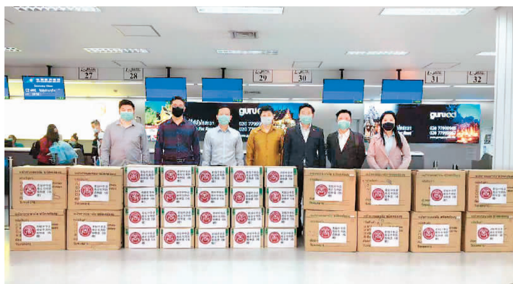
老挝中华总商会在机场运输物资。