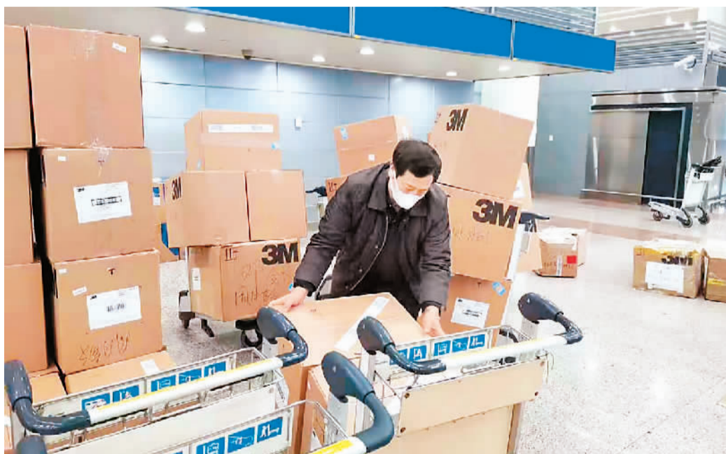
浙江省侨联工作人员帮助捐赠的侨胞清关并搬运物资。