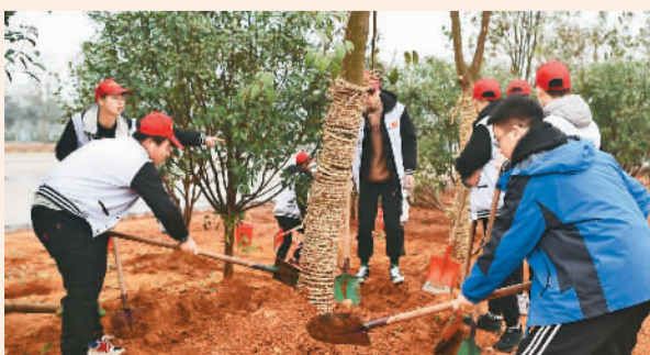
环保志愿者在湖北省宜昌市长江岸线上种树。

镇江把“共抓大保护，不搞大开发”当作压倒性任务来抓：一方面，加强对自然保护区的管理，对“江豚保护区”生态红线范围内的建筑物一律拆除，7000多亩江滩湿地全面停止并退出农业生产、水产养殖活动；另一方面，着力改善水域生态环境，守好江豚保护“主战场”。