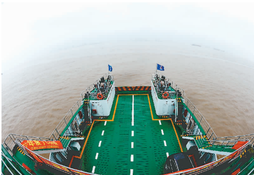
增殖放流的船舶抵达长江口水域。