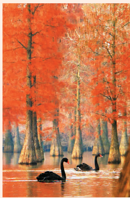
池杉湖国家湿地公园位于安徽省滁州市来安县与江苏省南京市六合区交界处，是长江下游沿江地区鸟类重要的集中栖居地。图为天鹅在池杉湖国家湿地公园游弋。

长江自西向东，奔流不息，孕育了历史悠久的华夏文明。然而，受到不合理的生产、生活方式影响，长江经济带曾一度成为中国水环境问题最突出的流域之一。4年前，“推动长江经济带发展必须从中华民族长远利益考虑，使绿水青山产生巨大生态效益、经济效益、社会效益，使母亲河永葆生机活力”的国家号令发出，至2020年，“共抓大保护，不搞大开发”的理念已经深入人心，长江沿岸省市不断破除旧动能，培育新动能，探索出一条生态优先、绿色发展的新道路。