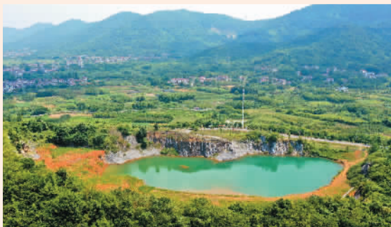
经过生态修复后的安徽省铜陵市铜官区西湖镇农村境内的废弃矿山。