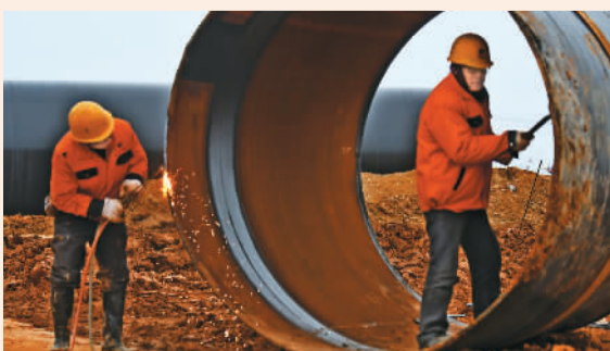
湖北省枝江市“保护长江化工搬迁转型”项目工地上，工人在安装循环水管道。