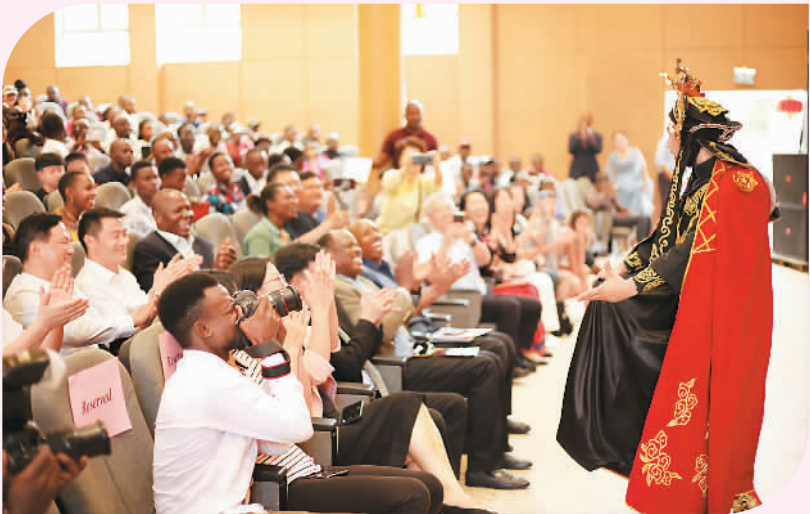
1月11日，在乌干达首都坎帕拉克雷大学，四川省歌舞剧院为观众献上精彩演出。

在传播类荣誉方面，《哪吒之魔童降世》《流浪地球》《攀登者》凭借着各自特点鲜明的海报入选2019年度传播电影海报案例。2019年度传播歌曲案例包括王菲演唱的《我和我的祖国》，周延、白阳演唱的《哪吒》以及周深演唱的《缘起》。2019年度传播营销案例授予了《哪吒之魔童降世》《流浪地球》《我和我的祖国》，这3部影片也与其他7部电影共同入选了2019年度传播十大电影榜单。