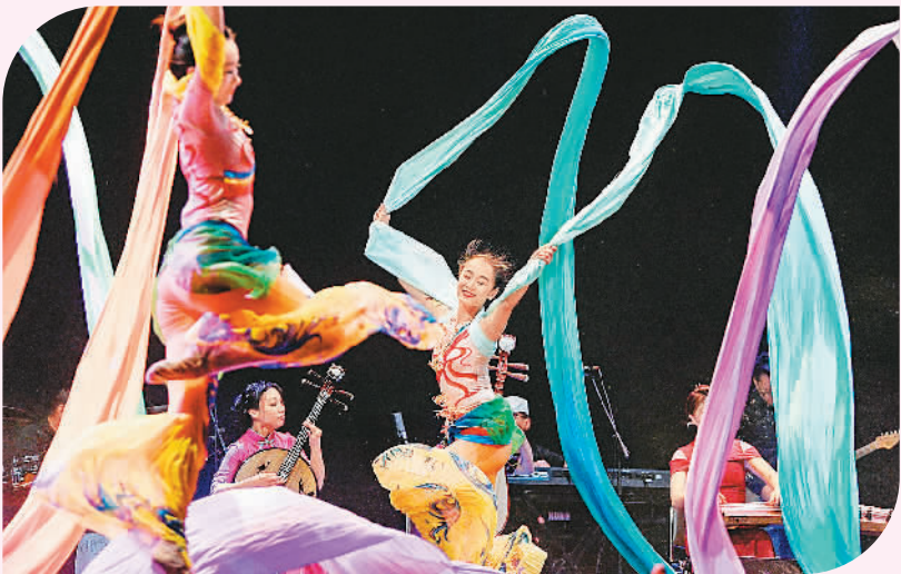
1月10日，第十届“欢乐春节”庆典晚会在智利比尼亚德尔马举行。图为深圳艺术团表演《敦煌新语》。