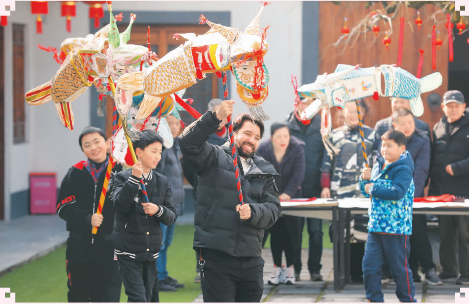
1月12日，浙江省湖州市德清县武康街道对河口村文化礼堂热闹不已，来自津巴布韦、伊朗、阿富汗等外国游客在当地村民的指导下，体验舞鱼灯，喜迎新春佳节。