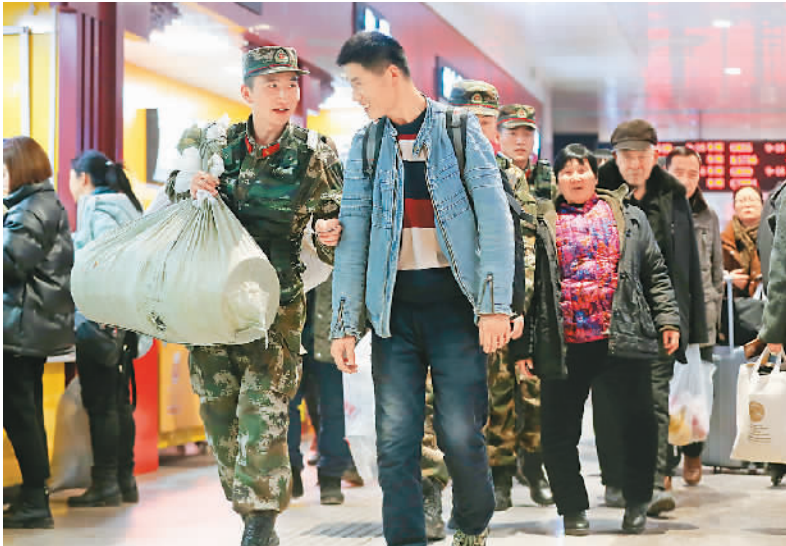
近日，郑州火车站迎来了春运客流高峰。武警郑州支队官兵出现在执勤一线，保障春运顺利进行。