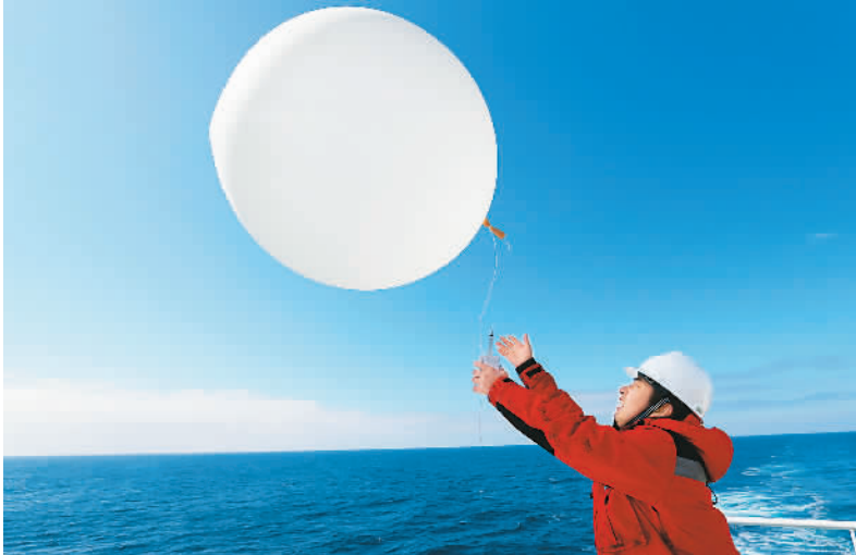
1月11日，正在南极科考的中国科考队员在“雪龙2”号极地科考破冰船上释放探空气球，探测气象要素。